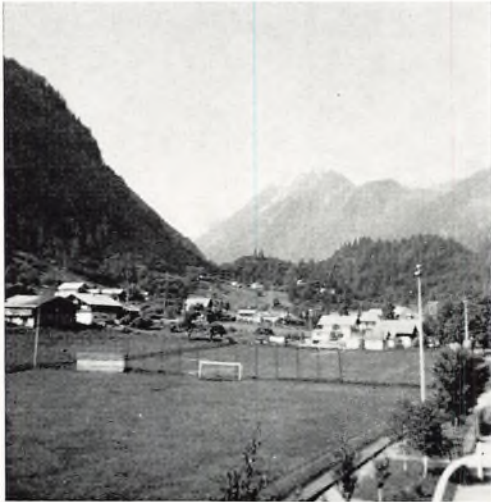
Udsigt fra værelset i Kaprun

Næste dag travede vi for alvor i bjerge. Vi prøvede også Kapruns lokale svævebane.