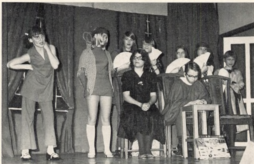
6. d opfører „De tre ønsker“ eller „Hvordan man får succes ved at falde gennem et hul“