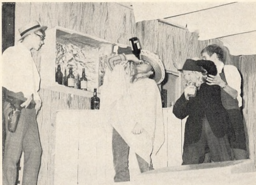
9. klasse og 2. real opfører „En cowboy's erindringer“ forfattet og instrueret af Hr. Bluhme.