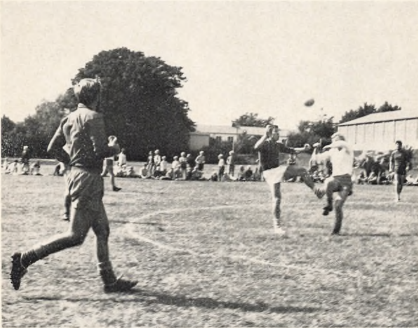
Fodboldkamp mellem lærere og elever

Fastelavnshåndboldstævnet i Grenaa-hallen gav to sejre til Østre skole. Drenge B vandt i finalen 10-7 over Trustrup, og piger A slog ligeledes Trustrup i finalen, her med 6-2.