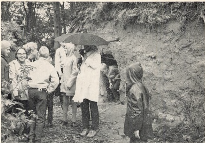
Besøg i et stenalderhus

Også om tirsdagen var der bustur. Denne gang til Zoologisk Have i København, et besøg, som hver gang er en succes. Børnene bliver ikke trætte af at se på de mange dyr.