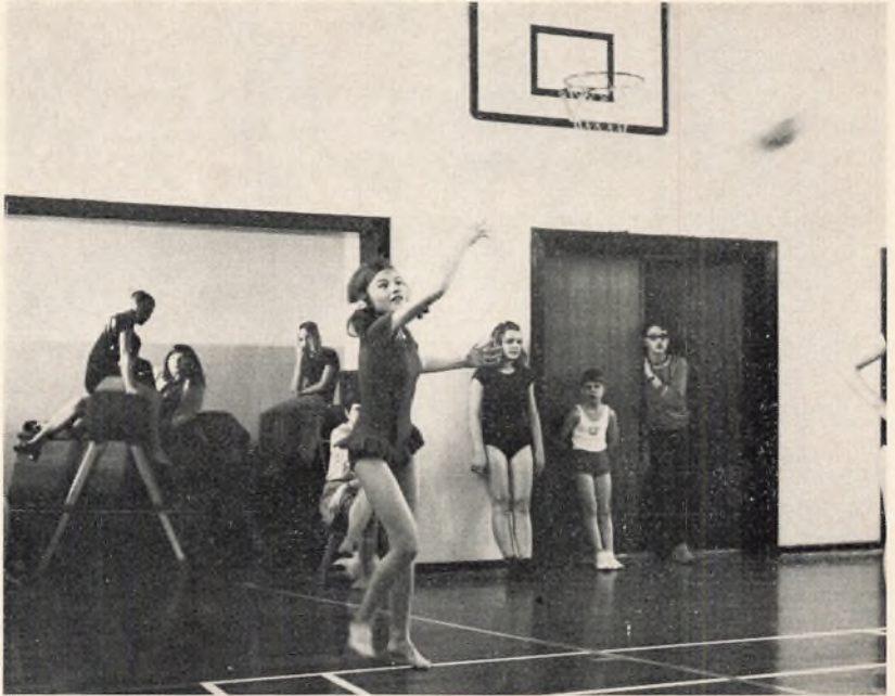
7 ab's piger spiller volley-ball