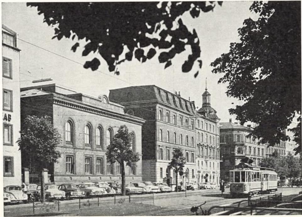
Nr. 5 og 7 på Nørrevold