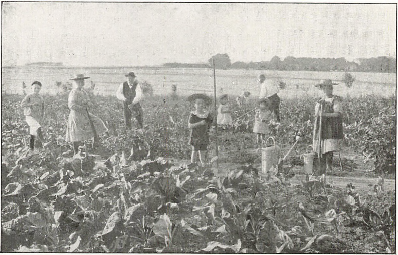
Billede fra Skolehaven.

blandt Eleverne. Betalingen for en Skolehavelod er Kr. 1,50 aarligt. Eleven skal holde sin Lod i god Orden og hjælpe til at rense de fælles Gange. Skolehaven er aaben for Eleverne hver Eftermiddag fra Kl. 5—7; de er forpligtet til at møde 2 Gange om Ugen. For de bedst dyrkede Lodder udsættes Præmier.