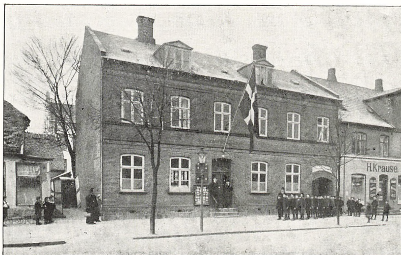
„Det røde Hus.“