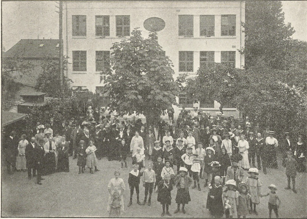
Fra Skolens 40 Aars Fest.