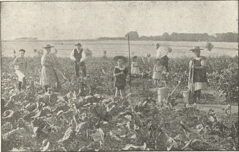
Billede fra Skolehaven.

sede med Liv og Lyst. I de sidste Aar er Interessen for Skolehaven noget svækket, hvilket er saa meget mere beklægtigt, som man vel næppe kan finde en sundere og fornøjeligere Syssel for Børn i den fri Luft end den, at de kan dyrke deres egen Jord og se deres Arbejde lønnes med rig Høst af Urter og Blomster. Det var derfor i høj Grad øn-