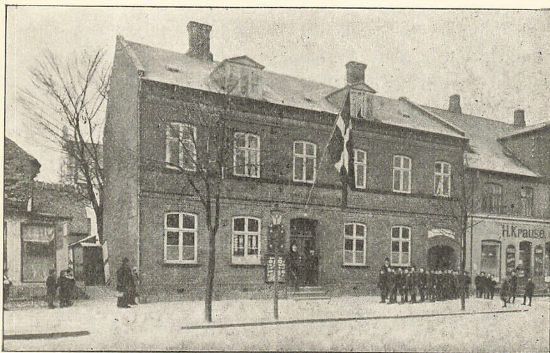
„Det røde Hus.“