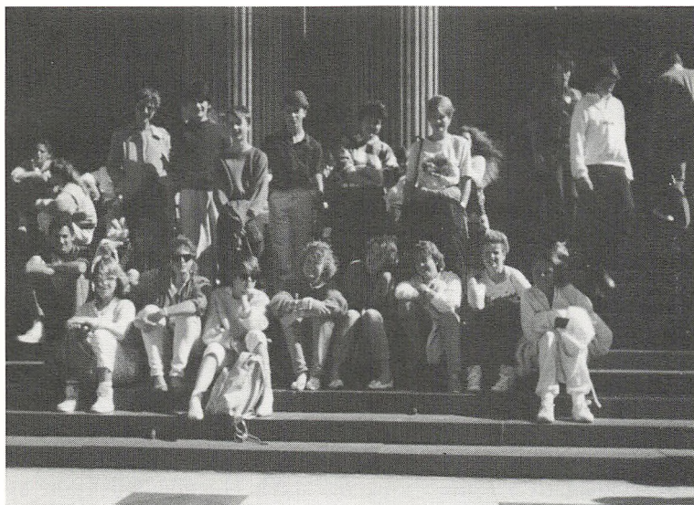
Foran St. Paul's