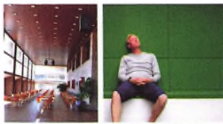
OMRÅDET - FOR

Med møblerne er inventaret dermed samlet i en skala der kan matche det store rum, bedre end stige-stole med små spidde ben kan det. Møblerne kan samtidig være vink og lade rummet åbent. I det der er monteret hjælp på den bærende ramme. Der er karakterer dimensioneret for netop dette.