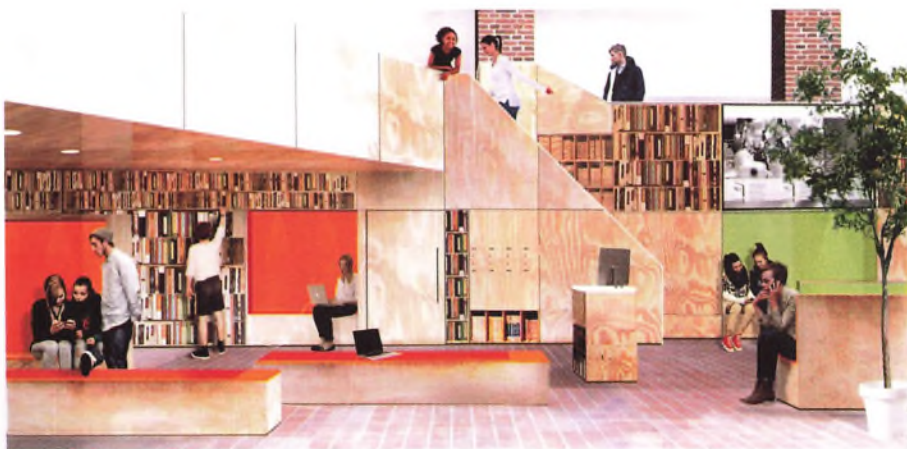
STUDIEBYEN: NYT BIBLIOTEK, MEDIATEK OG STUDIEMRÅDESPLADSER