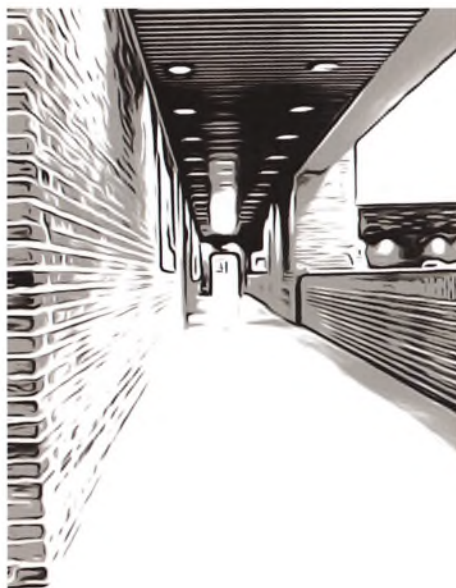
gang fra den nye bygning