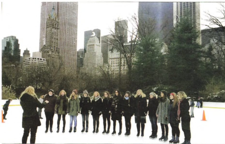
Duborg-Skolen lyspiger i New York

Tak for denne gang og tak til alle jer, der har været med til at realisere denne rejse! Ingen nævnt, ingen glemt.