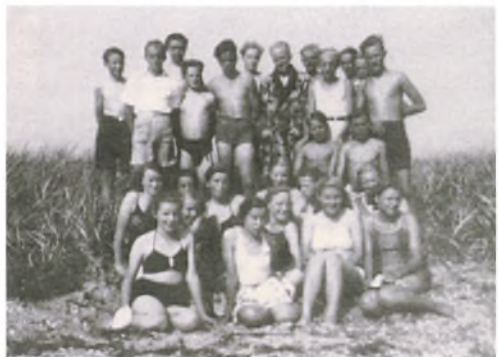
Fra en klassesetur til Holnæs 1949

Jeg kunne godt lide at skrive klausurer. Vi vidste, at prøveopgaver altid blev skrevet som klausurer. Gennem de relativt hyppige klausurer slap vi af med angsten for at sidde alene ved et bord i et stort rum og løse opgaver. Et kig til højre og venstre hjalp ikke. Desuden stod der altid en tilsynshavende bagest i lokalet.”