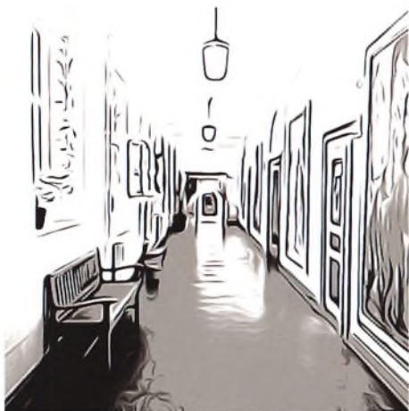
gang fra den gamle bygning

Og også i år har en bevilling fra Sydslesvigudvalget til Grænseforeningen muliggjort, at vi kunne drage til København med hele 13. årgang, bla. med besøg på Christiansborg. Turen blev afholdt med succes i slutningen af februar.