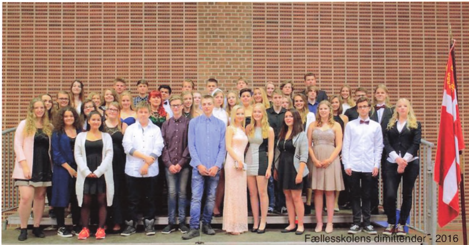
Fælleskolens dimittender - 2016