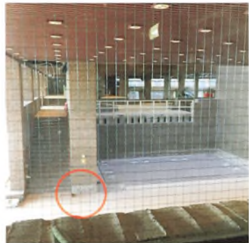
Grundstenen i henholdsvis 1977 og 2017