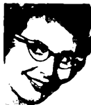
Aut. Zeiss forhandler