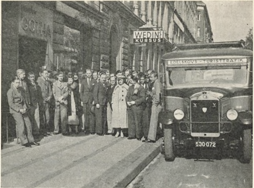
Starten til Kursus aarlige Heldagstur.