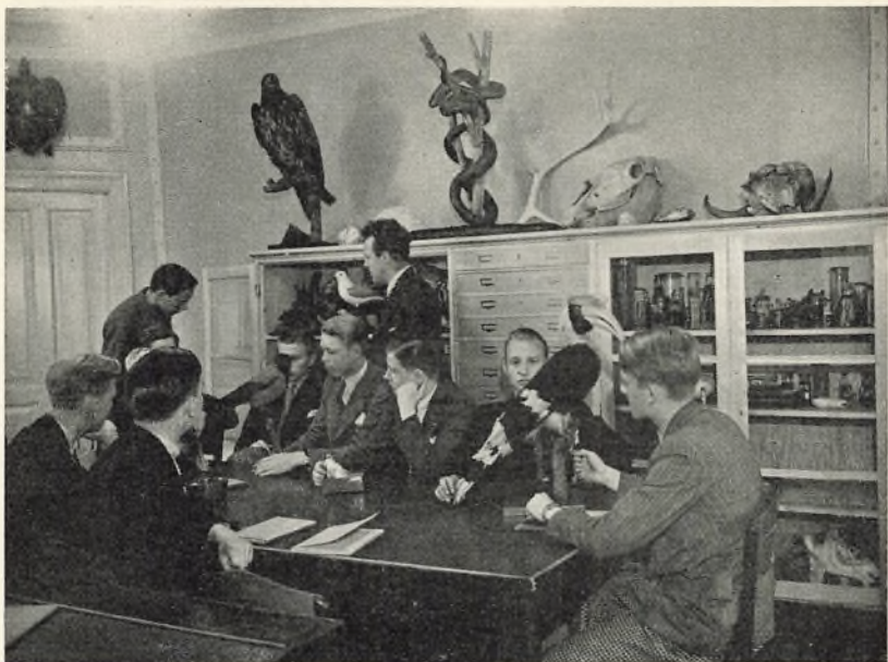
En Time i Naturhistorie.

saa høj Grad gør Tilegnelsen af Stoffet lettere for Eleven, ligesom Laboratoriearbejde er muliggjort for de Elever, der forberedes til de højere Eksaminer.