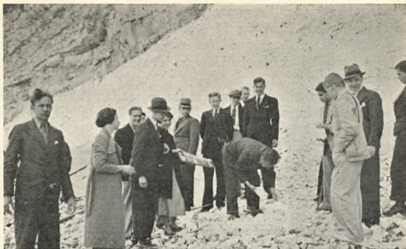
Praktisk Undervisning i Mineralogi ved Stevns Klint.