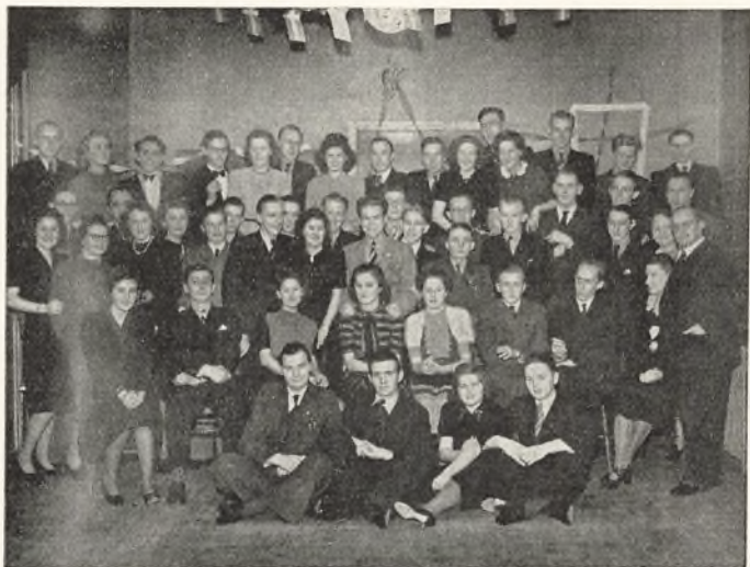
En Del af Deltagerne i Kursus Julefest.

miekonkurrence, et lille Kunstnerforum. Først hen paa Aftenen sluttede denne prægtige Tur, der var begunstiget af det herligste Sommervejr.