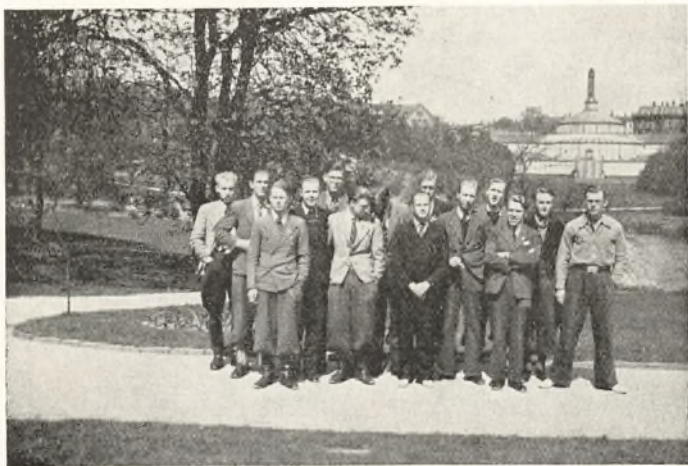
Ofte tilbringes Frikvarteret i Botanisk Have, som ligger vis-à-vis Kursus.

Det er saaledes Kursus en stor Glæde at se tilbage paa Aaret, der svandt, ikke mindst paa Arbejdet og de mange smukke Resultater, som blev opnaet. I forløbne Sæson har ialt 97 bestaaet deres Eksamen, idet 23 har bestaaet Tillægseksamen til Den Kgl. Veterinær- og Landbohøjskole, 11 Fællesadgangseksamen, 1 Adgangseksamen til Kunstakademiets 3. Bygningsklasse, 9 Præ-