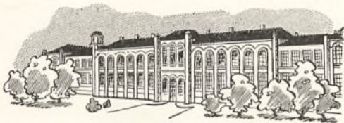
Den kgl. Vetr.- og Landbohøjskole

Tillægs- prøve til Den kgl. Veterinær- og Landbo- højskole for Veterinærer Landinspek- tører og Skovbrugere