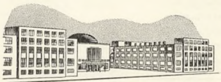
Danmarks tekniske Højskole

Da Kravene til denne Adgangseksamen i det store og hele svarer til den matematisk-naturvidenskabelige Studentereksamens Krav i Matematik, Fysik og Kemi, er Forudsætningen for at kunne klare denne Eksamen med tilstrækkelig godt Resultat paa eet Aar, at man har gode Forkundskaber i ovennævnte Fag samt gode Anlæg for Matematik og Fysik. Med denne Forudsætning vil det imidlertid være muligt for enhver, der aktivt følger den af Kursus lagte Undervisningsplan, at naa et tilfredsstillende Resultat inden for de godt 10 Maaneder, Kursus varer, da Undervisningen for dette Kursus er lagt med den specielle Adgangseksamen for Øje.