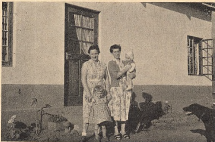
Uden for huset. Det er en tysk missionær og hendes børn. De boede her en tid

Tilbage til skolen. Hele flokken (103) er som sagt på ferie, og der hersker en egen stilhed for tiden, som man skal vænne sig til, før man kan lide den. Pigerne er alle kostskoleelever og har været søde og fornøjelige indtil nu. Selvfølgelig