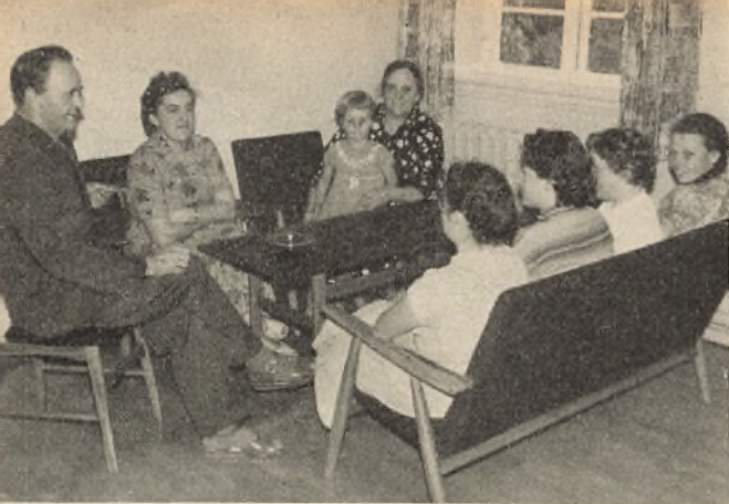
Et hjørne af dagligstuen.

til han en dag kom for skade at høre denne bemærkning: „Ja, det er godt nok, at forstanderen tænker på at skaffe bedre plads til køerne, men han er ligeglad med, hvordan lærerinderne og eleverne bor!“ — Nu er der imidlertid omsider skaffet bedre plads både til lærerinderne og eleverne.