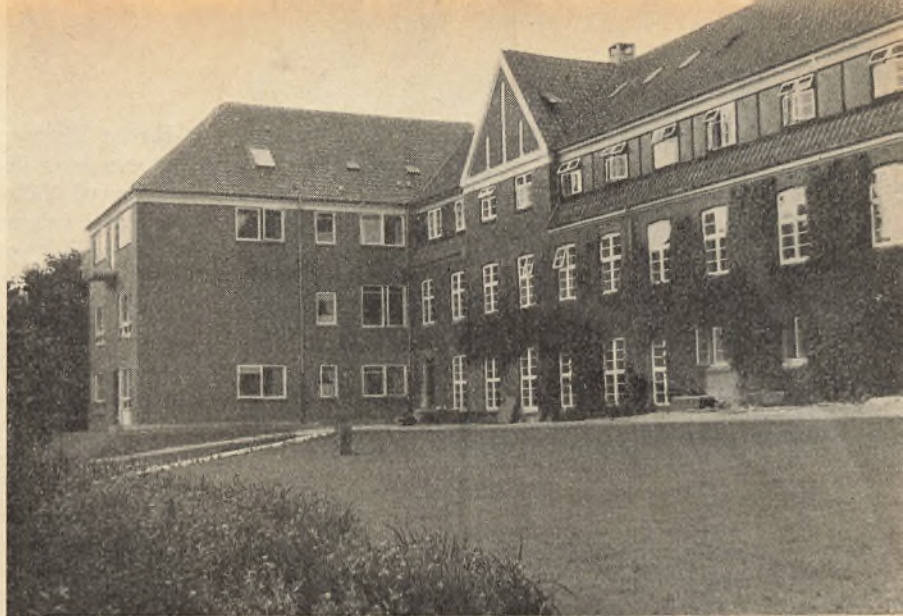
Skolen set fra „Grotten.“

350 deltagere — fortrinsvis gamle elever — i højskolens jubilæums- og byggefest. Foredrag af undervisnings- ministeren, mange taler og smukke gaver