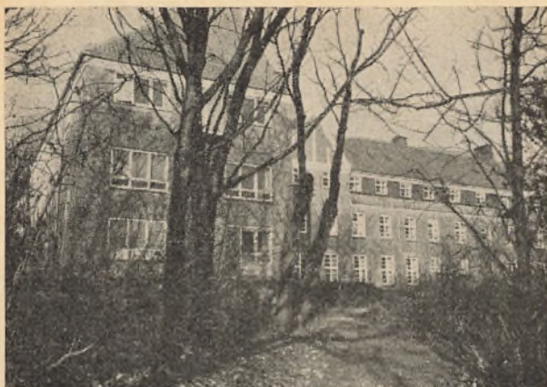
Skolen set fra syd