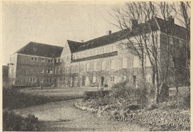
Skolen set fra Grotten

Efterskoleklassen rummer en hel del dejlige, store drenge, og så er der nogle stykker, som vi håber at blive glade for efterhånden. Sådan plejer det da heldigvis at gå. Ofte må jeg tæn-