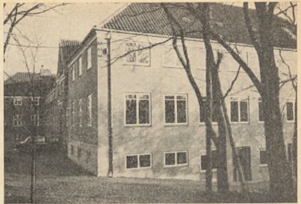
Skolen set fra vest

Ved bogreolen standser vi op. Fruen tager en bog ud. Vi er ude af stand til at sige, hvad den hedder. Det er Frans af Assisi på japansk. Den er nu oversat til 18 forskellige sprog. Nu kommer den snart på portugisisk. Fruen har lige underskrevet kontrakten. Så vidt ud er denne bog nået. Så international er Johannes Jørgensens kunst. Han sang engang om at slippe navn og ære, det var, da han sluttede sig til den katolske kirke og fandt hjem til sin mors Gud igen, men han vandt navn og ære langt ud