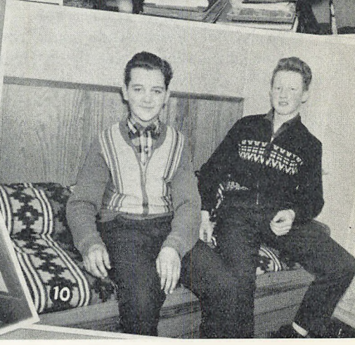
Billedmontage fra skolens liv