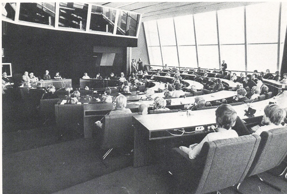
Drengkorets medlemmer i Europarådet i Strasbourg.