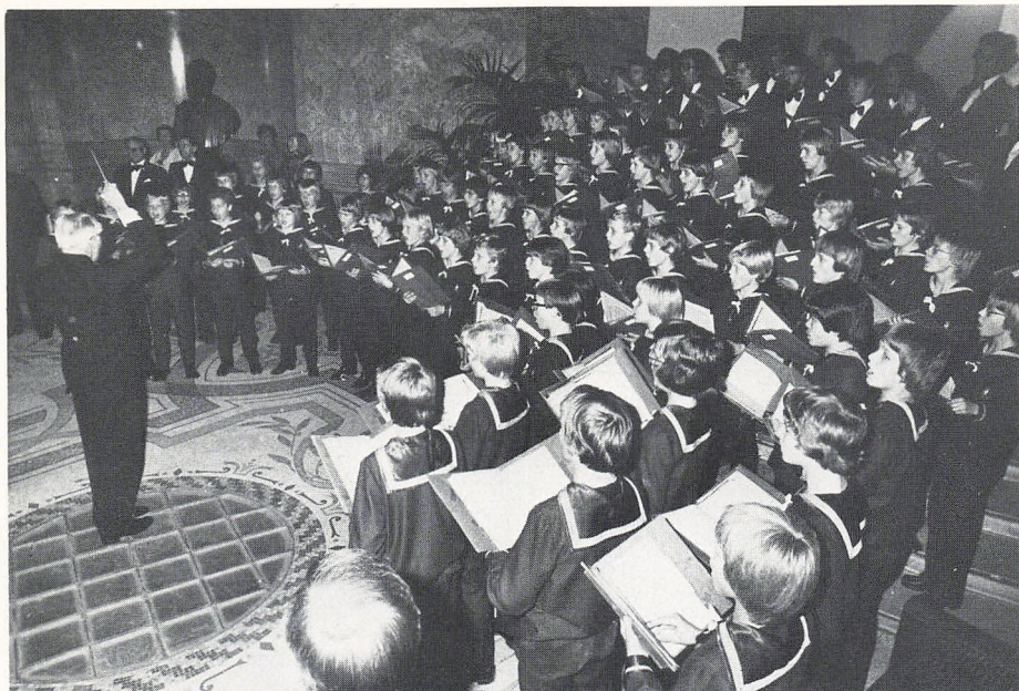
Drengkoret i Paris.