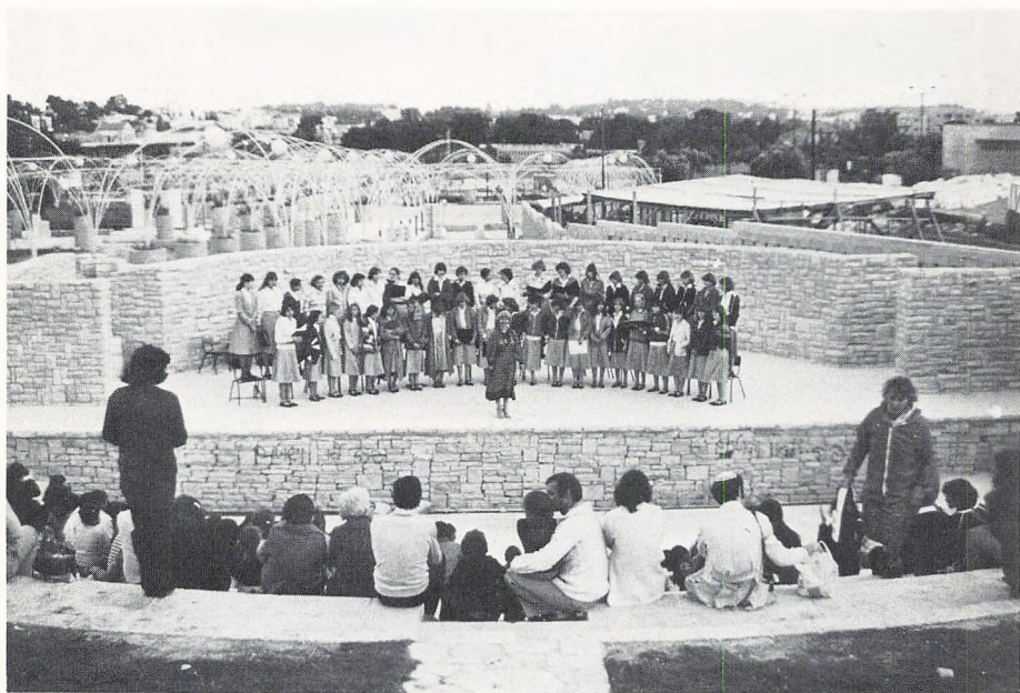
Pigekoret i Jerusalem