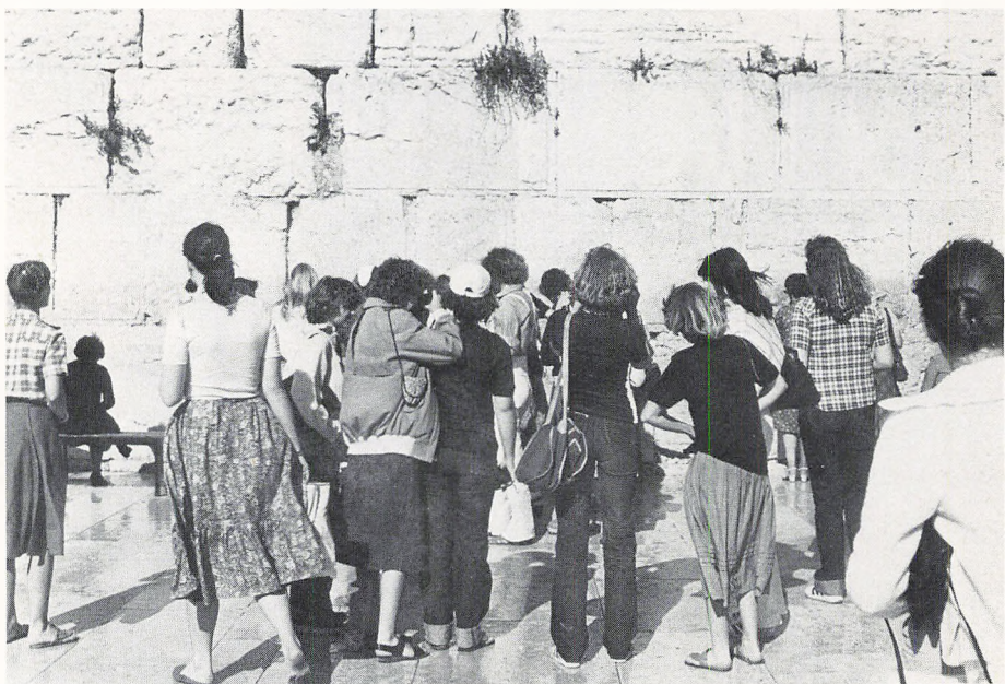
Pigerne ved grædemuren