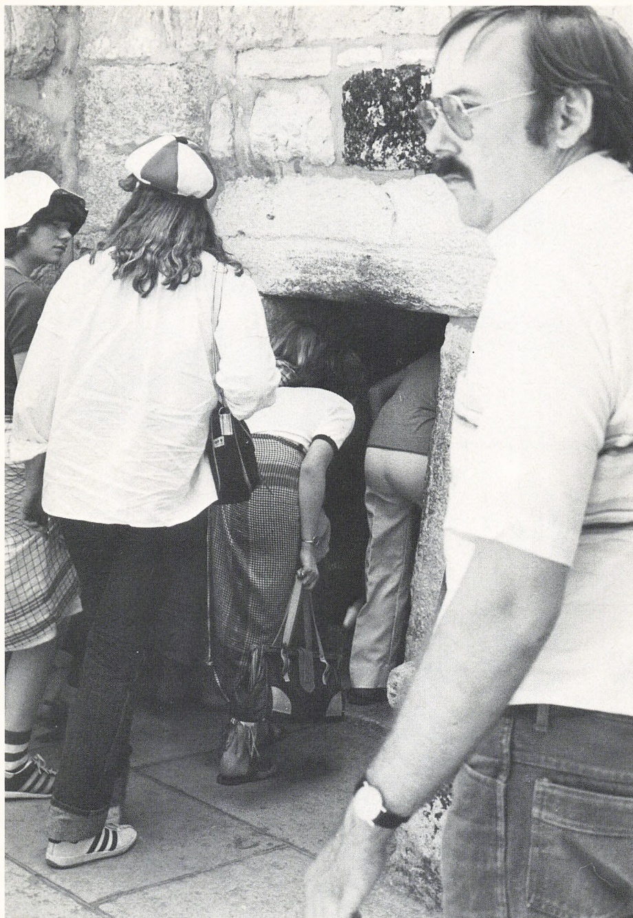
Indgangen til Bethlehemskirken