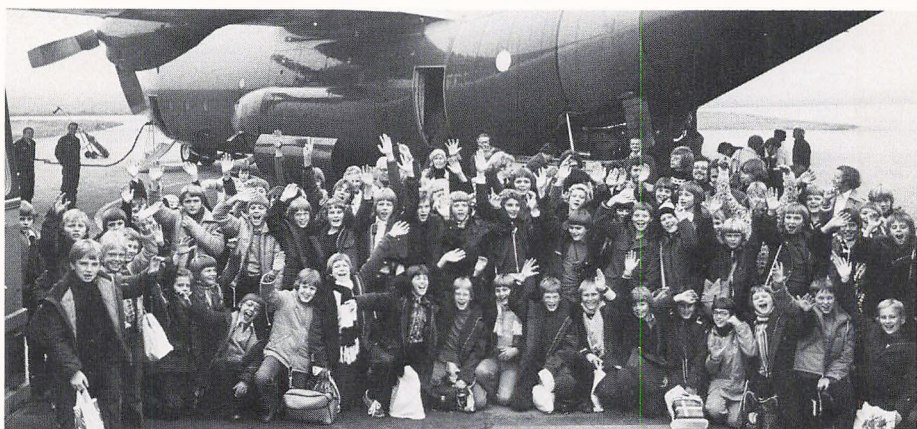
Drengeskoret ved afrejsen til Paris fra Værløse.