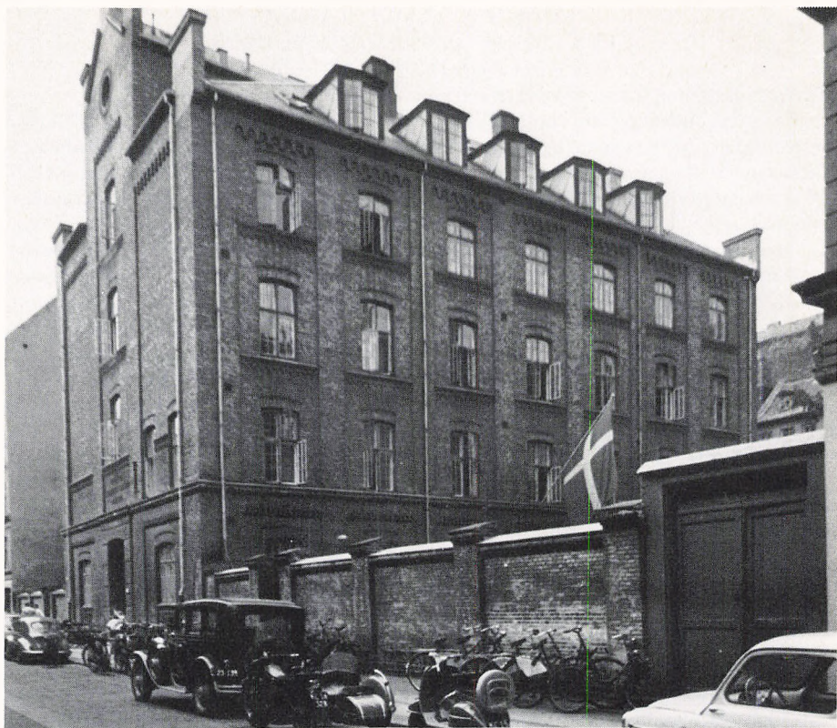
Den gamle bygning i Hindegade - Fredericiagade.

begunstigede, de som igennem hele deres skoletid har lært at samarbejde med andre og som har forstået, at det er nødvendigt at yde sit bedste, hver eneste gang man arbejder, for at nå det bedst mulige resultat.