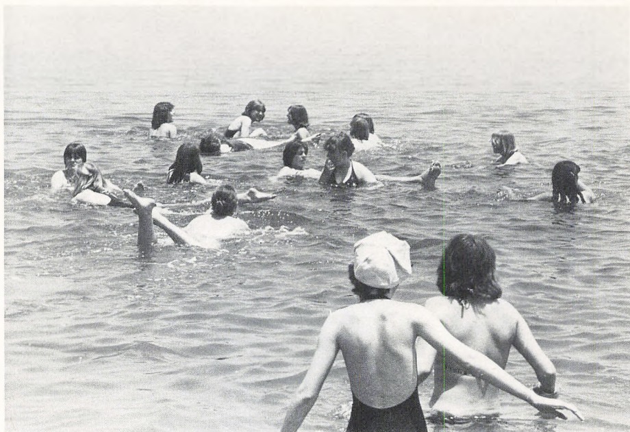
Pigerne bader i det døde hav