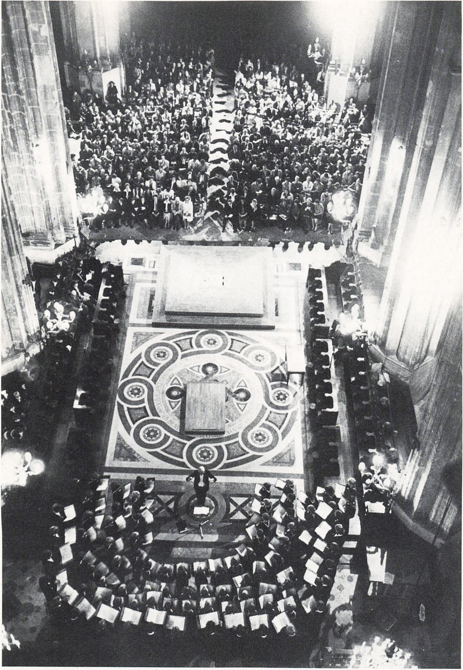
KØBENHAVNS DRENGEKOR i Saint Eustache, Paris.