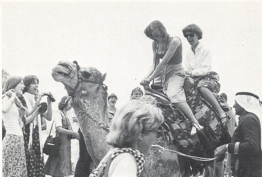
Inga højt til kamel