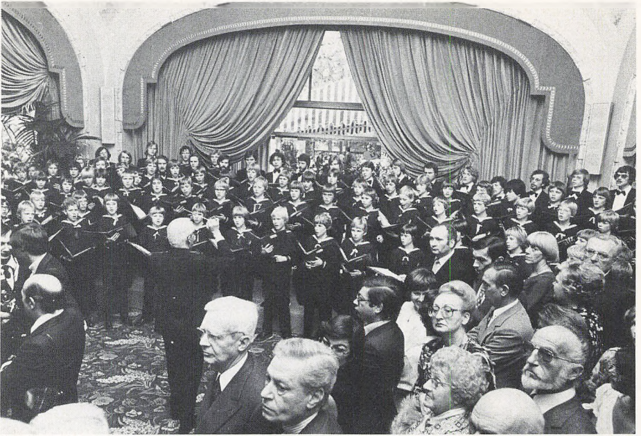
Drengkoret synger for Dronning Margrethes gæster