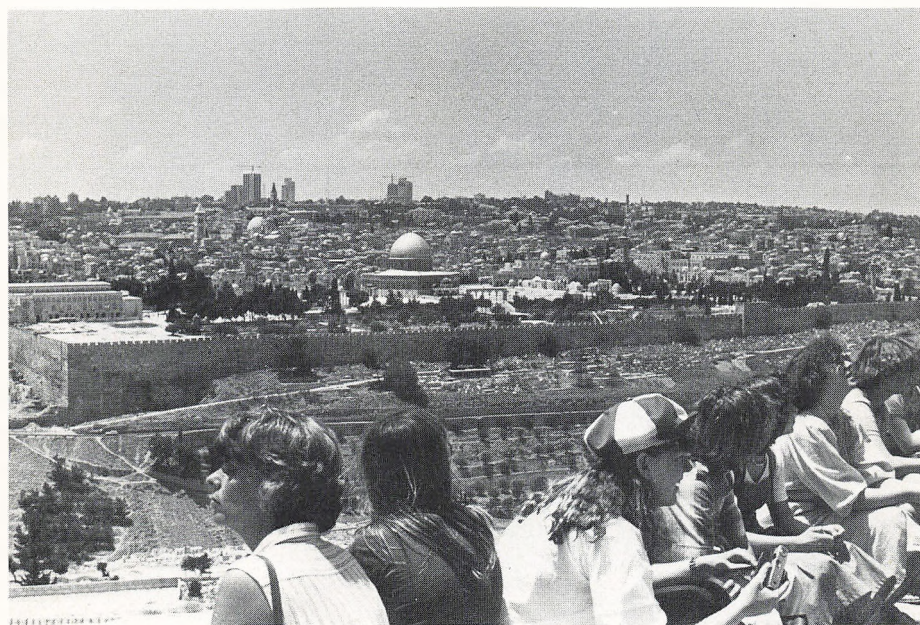
Udsigt over Jerusalem