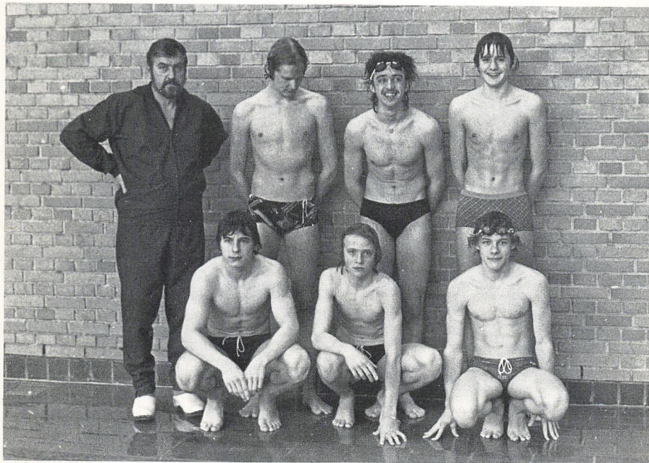
Et af skolens dygtige svømmehold