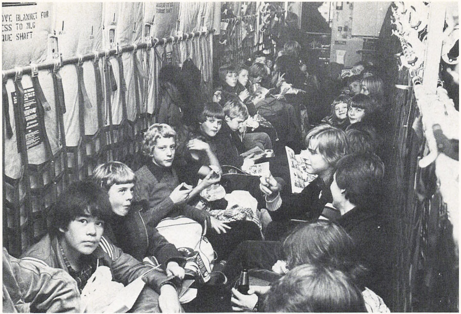
Flyvetur i Herkules - maskinen