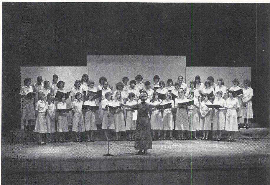
Pigekoret synger i kibutz Dorot