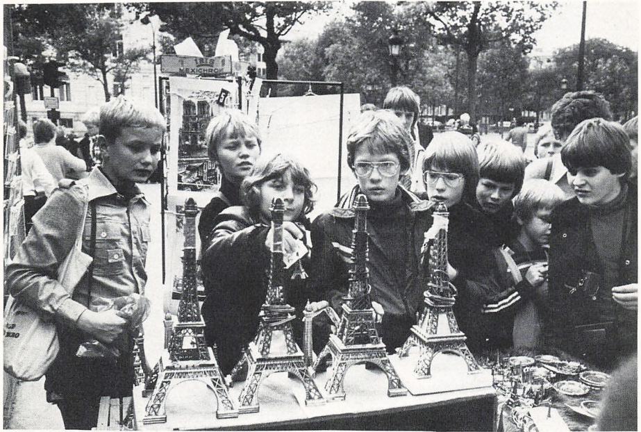
Valget er svært