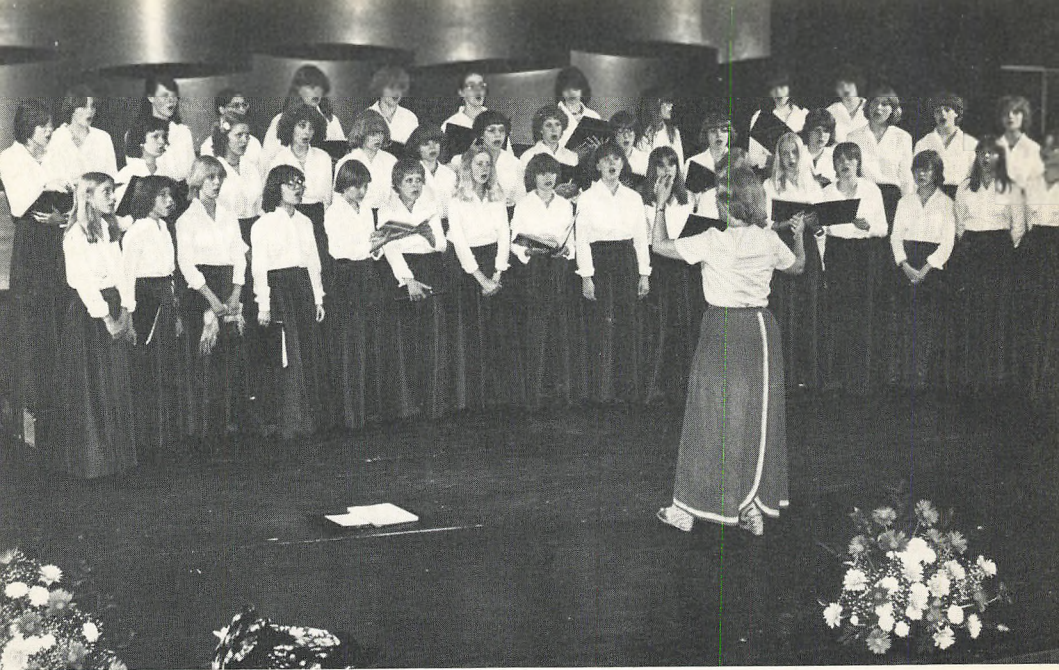
SANKT ANNÆ GYMNASIUMS PIGE KOR