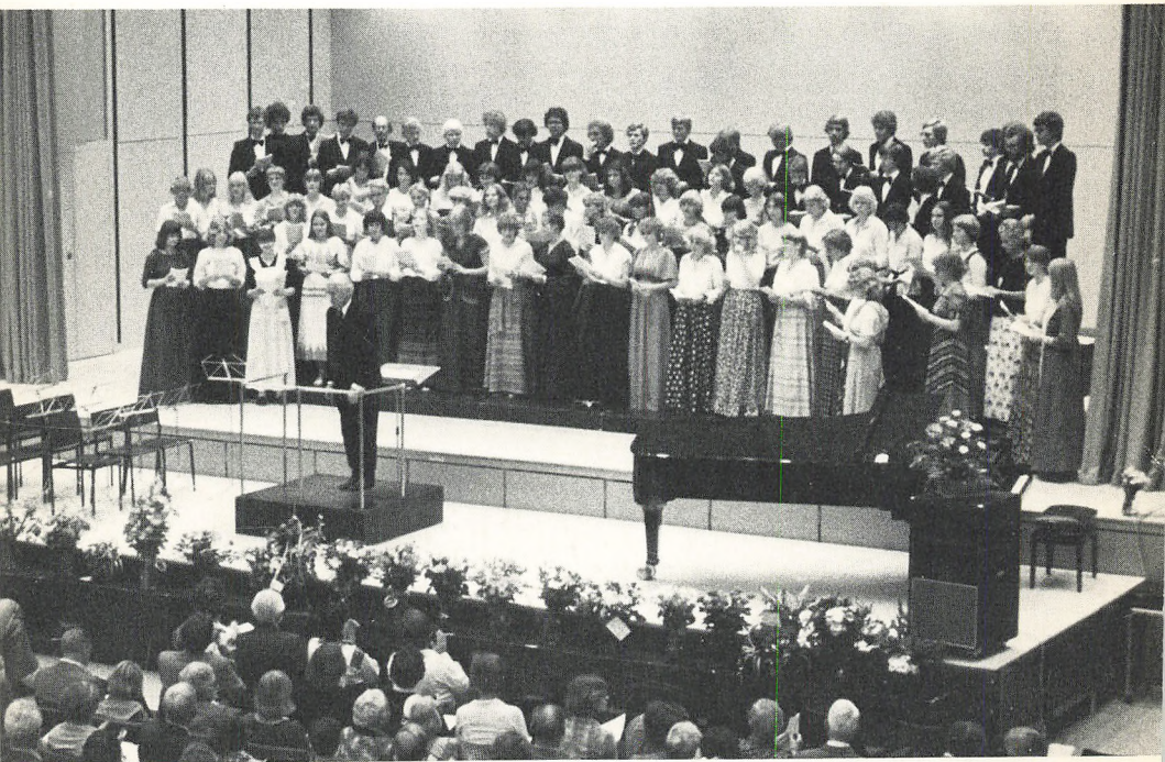
SANKT ANNÆ GYMNASIE KOR