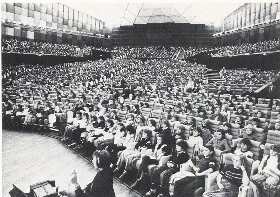
Københavns Drengekor synger for 2000 børn i Strasbourg.