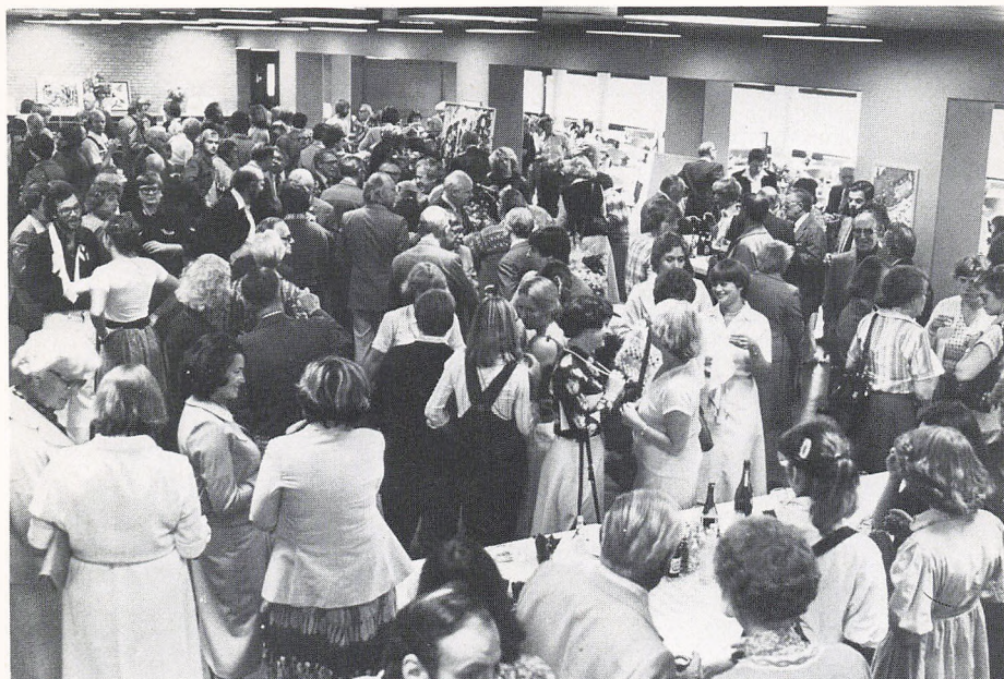
Trængsel ved jubilæumsreceptionen