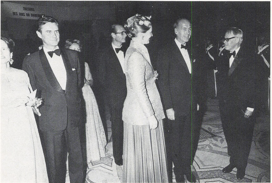
Mødet med Dronning Margrethe og Præsident Giscard d'Estaing.