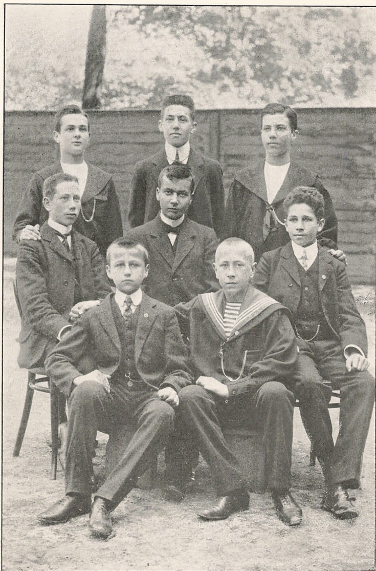
SKOLENS SIDSTE PRÆLIMINARISTER OG FØRSTE MELLEMSKOLEEKSAMINANDER