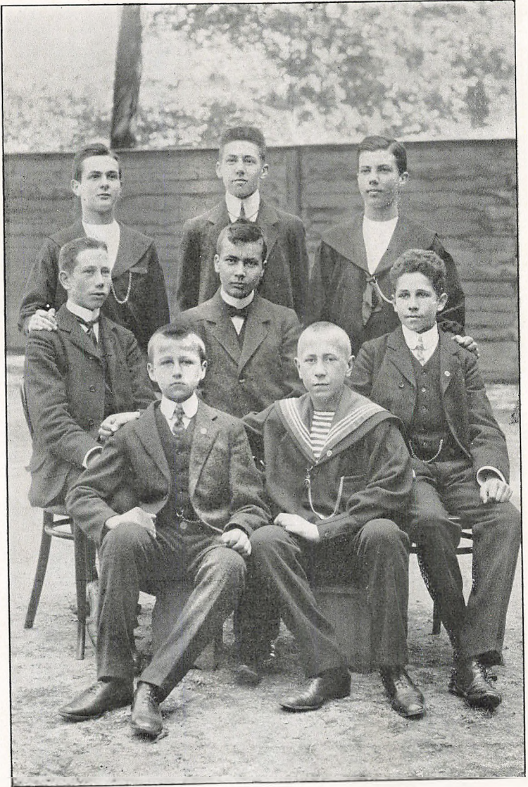
SKOLENS SIDSTE PRÆLIMINARISTER OG FØRSTE MELLEMSKOLEEKSAMINANDER