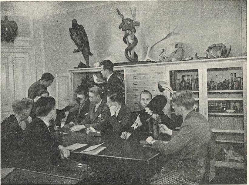
En Time i Naturhistorie.

Kursus vigtigste Nyanskaffelse i den forløbne Sæson er dog en Siemens Filmsgengiver, hvorved det er blevet muligt, paa en meget effektiv Maade, at supplere Undervisningen i Naturfag, idet Kursus i Lighed med Skolerne foruden at leje Undervisningsfilm, selv har anskaffet en Del udmærkede naturhistoriske og geografiske Film, en Samling, som agtes forøget med Nyanskaffelser.