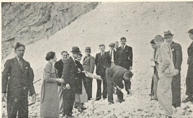
Praktisk Undervisning i Mineralogi.

Endelig den 8. Maj fandt Kursus aarlige Heldagstur Sted. I store moderne Turistbiler tog vi til Roskilde for at besøge Roskilde Andelsslakteri, hvis mange Afdelinger blev os forevist og forklaret. Videre gik Turen til Kemisk Værk, Køge. Navnlig for de kemistuderende ved Kursus var dette Besøg af overordentlig stor Værdi; men ogsaa for de Deltagere, som stod fremmed over for Kemi, var Besøget interessant og fængslende. Inden vi forlod Kemisk Værk, spiste vi vor medbragte Frokost i Fabrikens Spisestuer, som velvilligst var stillet til vor Disposition af Direktionen, som desuden bød paa Drikkevarer til Maden.