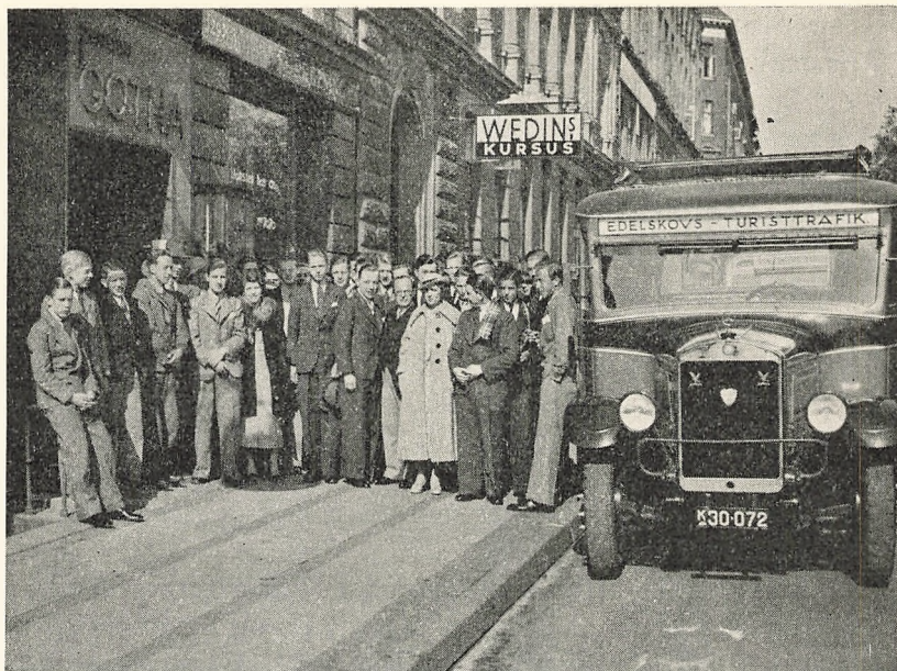
Starten til Kursus Heldagstur

Assistance, saaledes at Eleven uden Omkostninger for sig og sin Familie bliver bragt til sit Hjem i Bil eller Ambulance, naar Forholdene maatte kræve det. Ved mindre Ulykkestilfælde staar Redningskorpsets Forbindskasse til Disposition.