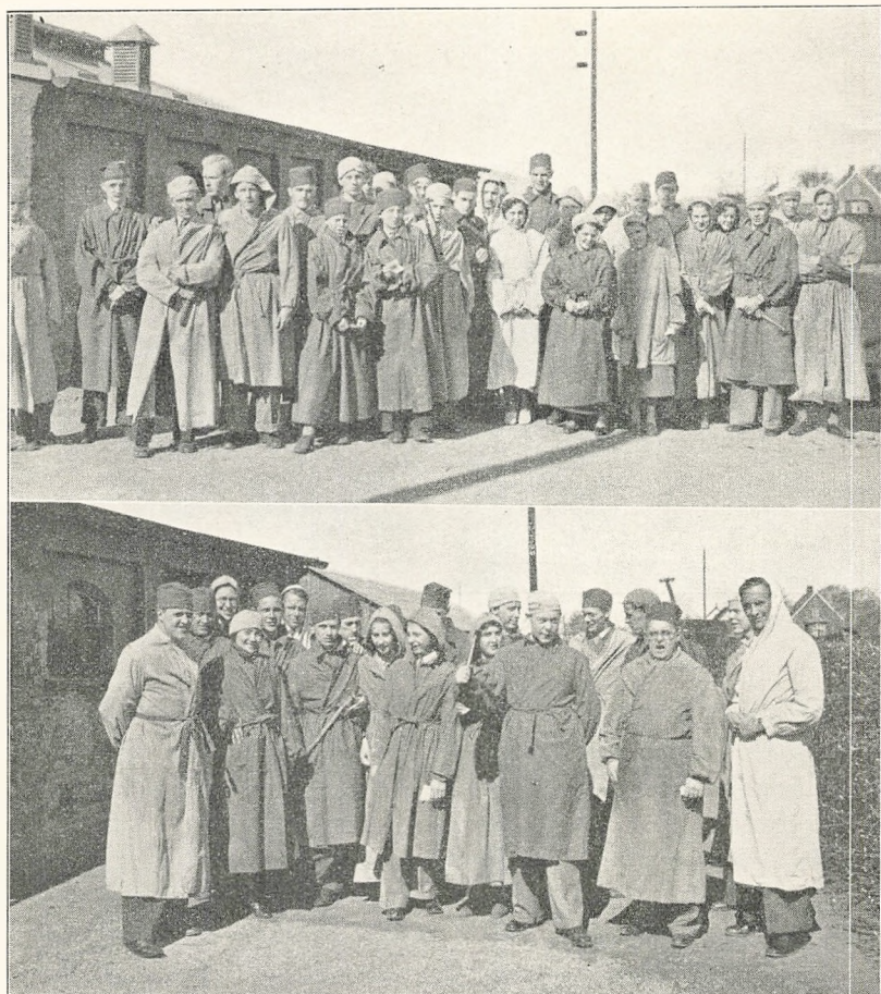
Paa Besog i Höganüs Kulgruber.