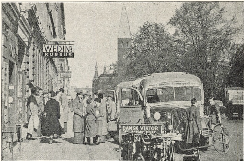
Starten til Kursus Heldagstur.

I November Maaned aflagde ca. 70 Elever og Lærere et vellykket Besøg paa ALLERS Etablissement i Valby; her blev først den til Etablissementet hørende Papirfabrik forevist under kyndig Vejledning, saa man fik Lejlighed til at følge Papirets Tilblivelseshistorie lige fra det som en grødet Masse gennemgaar de mange Processer, til det som færdigt Papir kommer ud af den store Maskine. Ikke mindre interessant var den derpaa følgende Gennemgang af Trykkeriets mange forskellige Afdelinger.