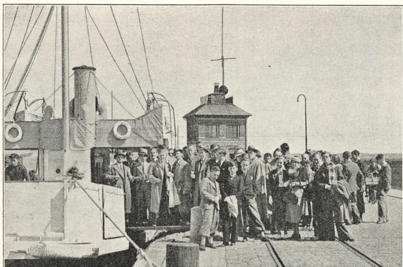
Indskibning til Sverige.

ter Frokosten fortsatte vi Turen over Sundet til Helsingborg, hvor en Del af os brugte en halv Times Tid til at se Byen, medens andre besøgte Kärnan, fra hvis Top de nød den herlige Udsigt over de to Sundbyer. Derefter fortsattes Turen i straalende Solskin op langs den svenske Øresundskyst til »Sofiero« med Besøg i Slotshaven og videre til »Gustaf Adolf« Kulgruben i Höganäs. Iført Grubetøj tog vi med Elevatoren 103 m ned under Jordens Overflade og fik her et levende Indtryk af, hvorledes Livet og Arbejdet i en Kulgrube former sig. Fra Kulgruben tog hele Selskabet til Höganäs By, hvor vi efter et Besøg hos en Kunstkeramiker indtog en herlig Kop Kaffe i Stadshotellet. Endelig gik Turen hjemad og sluttede med Middag paa »Udsigten« i Skodsborg, hvor Resten af Aftenen blev tilbragt under fornøjeligt Samvær.