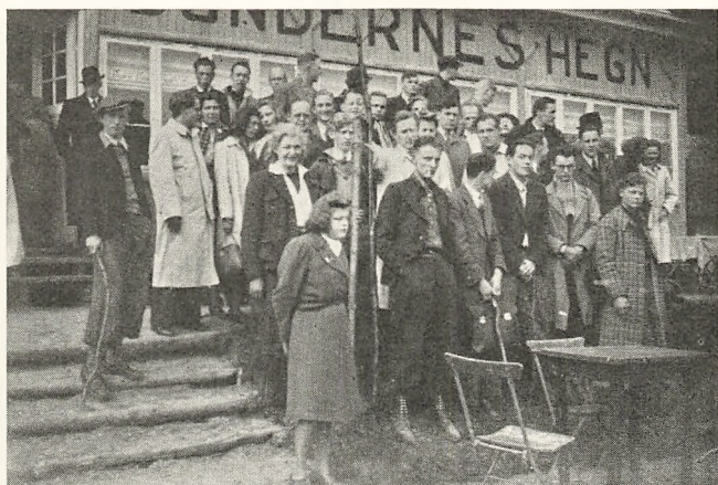
Fra Heldagsturen 1941.

Da Turen efter et hyggeligt Samvær og en god Kop Kaffe i »Bøndernes Hegn« sluttede med Hjemkørsel med Slingerupbanen, var der almindelig Begejstring over den helt ud vellykkede Tur.