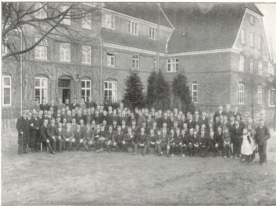
Era Vinterskolen 1913-14.