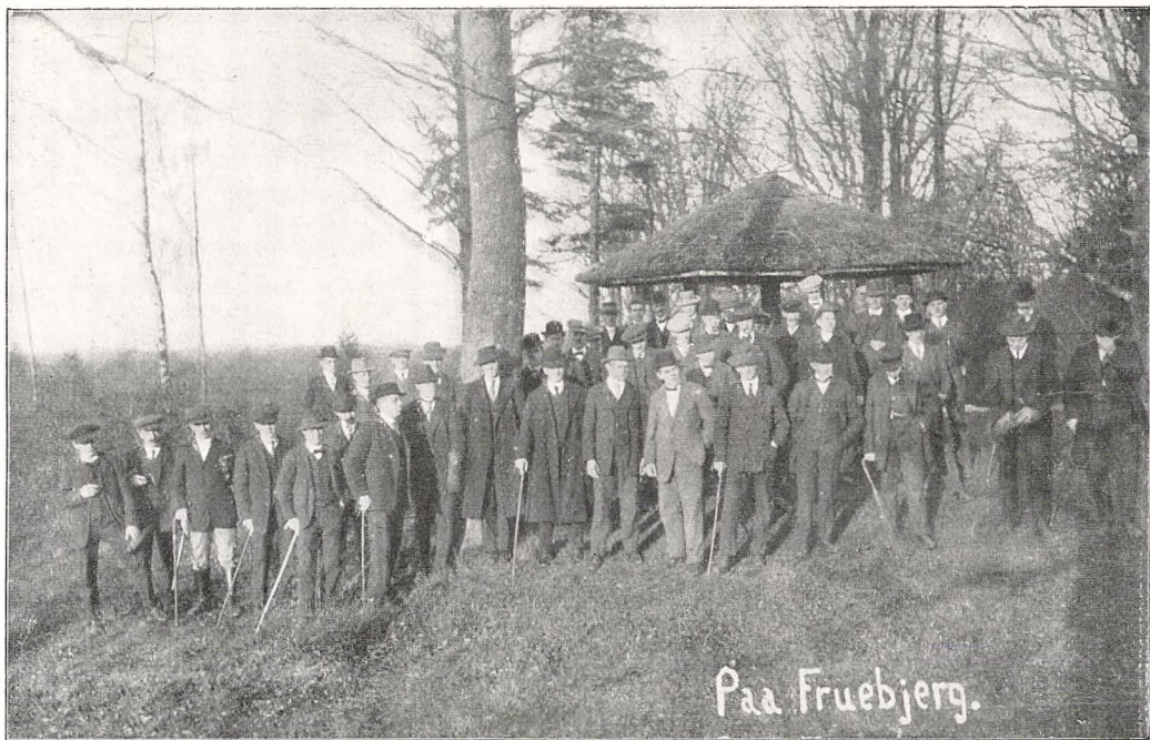
Paa Fodtur Søndag Eftermiddag.