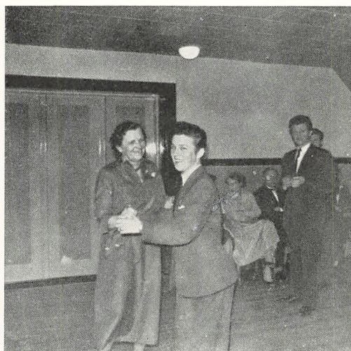
– og dansen den går.

endnu sidder i sindet indtrykket af mange gode oplevelser med vinterens efterskole.