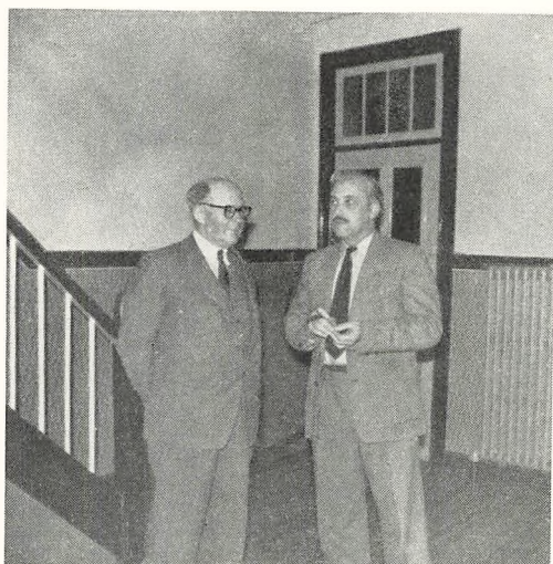
Mens eleverne fester.