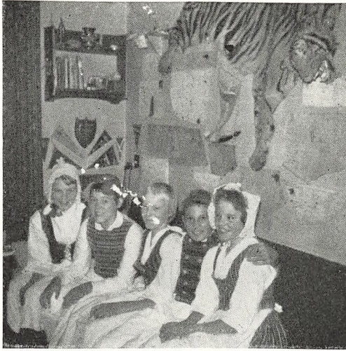
Fem folkedansere under Worms tigerskind.