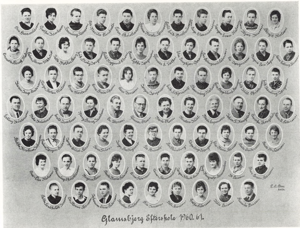
Glemstjerg Skole 1960. 61.