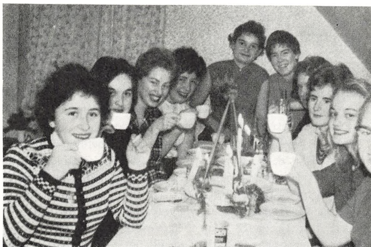
Julestue hos realpigerne.

Den 6. jan. 1961 var vi atter samlede på skolen, denne gang til juletræsfest for børneskolens elever. Samme aften vendte kosteleverne tilbage fra juleferien, og snart gik skolearbejdet sin vante gang.