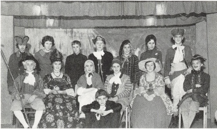
Skolekomedie i 7. klasse. »Erasmus Montanus«.

kaler, hvor undervisningen skulle foregå m. m. m. for så at slappe af ved flæskestegen Mortensaften.