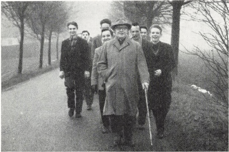
Sidste søndag før jul. Spadseretur.