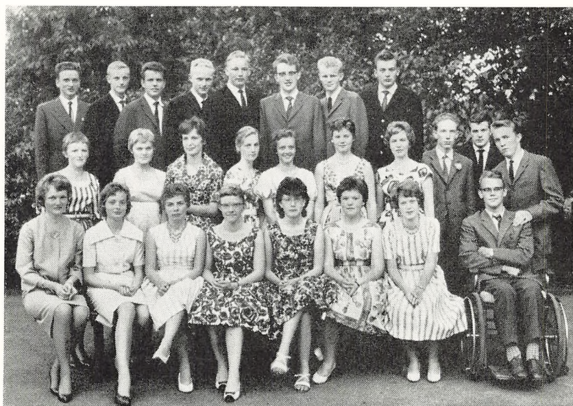
Eksamensholdet juli 1961 (3 årigt).