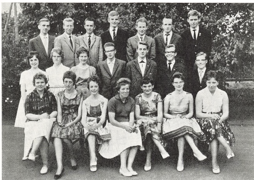
Eksamensholdet juli 1961 (2¼ årigt).