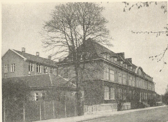
Skolen set fra Skolevej.