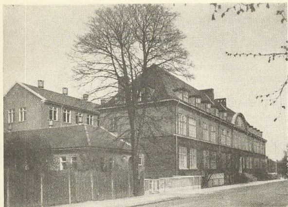
Skolen set fra Skolevej