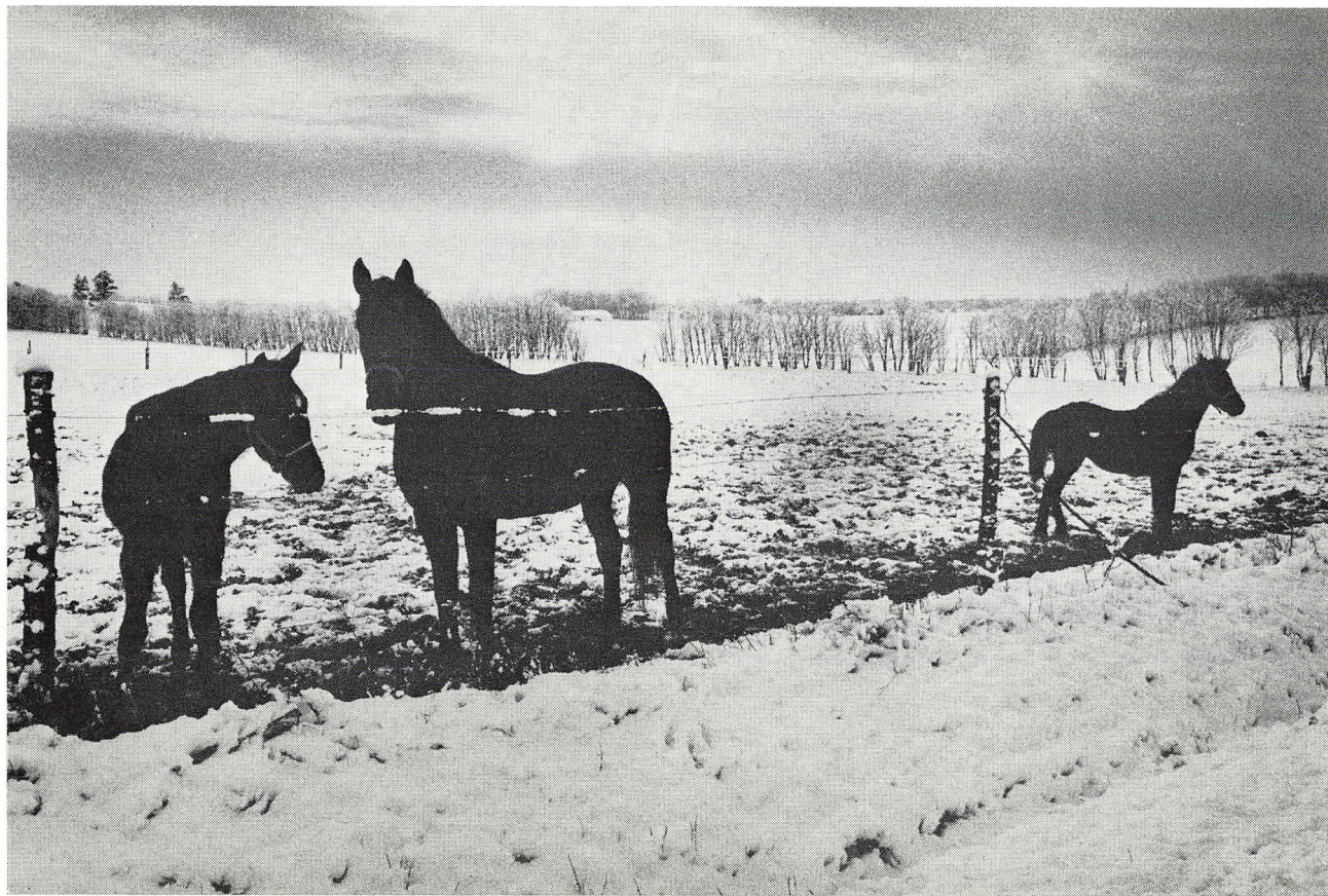
Vinterlandskab mellem Askov og Malt.