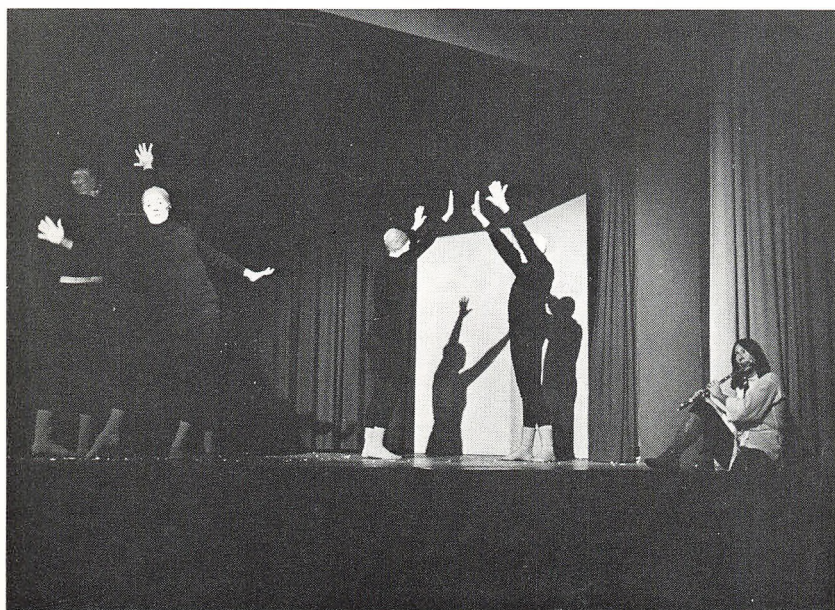
Mimeindslag til fløjteakkompagnement ved elevunderholdningsaften. (Vinterskolen).