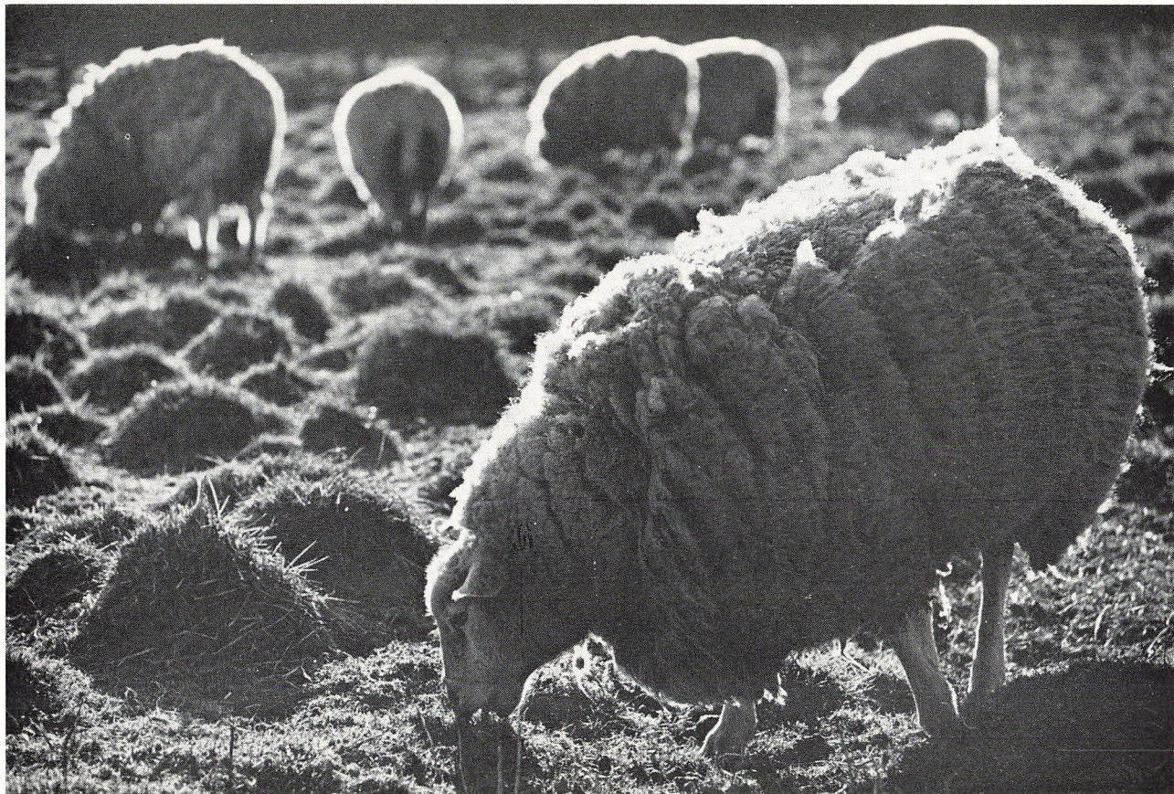
Sommerlandskab nær Egtved.