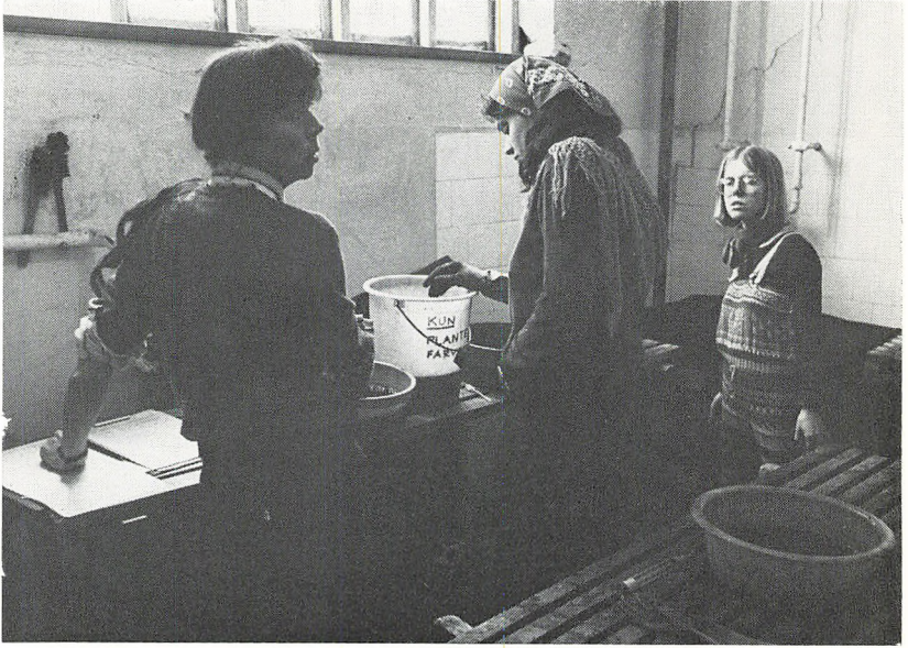
Plantefarvning i Gule Hus — for sidste gang. (Vinterskolen)