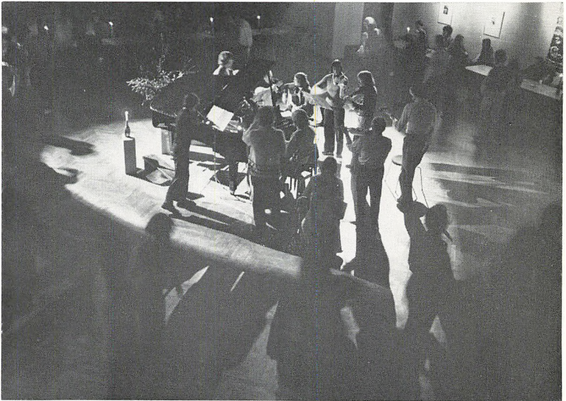
Folkemusikgruppen spiller til folkedans i Festsalen. (Vinterskolen)