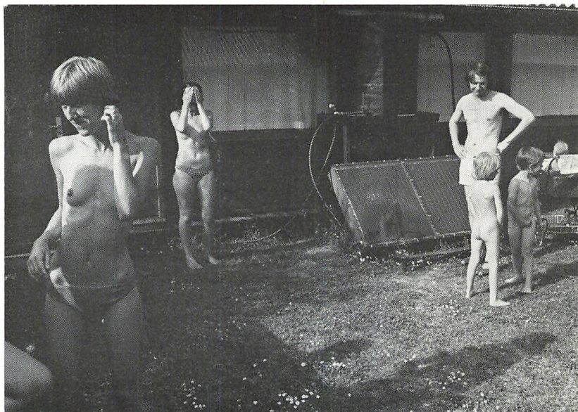
Solvandvarmeren — og dens »opfinder« — i funktion efter udendørsgymnastik. (Sommerskolen)