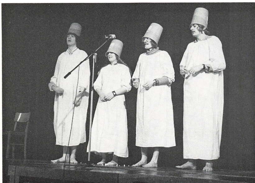
Elevunderholdning («Barbershopsange»). (Vinterskolen)