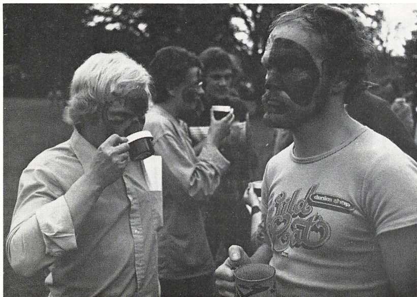
Maskebal? – nej, bare kaffedrikning i haven. (Sommerskolen)