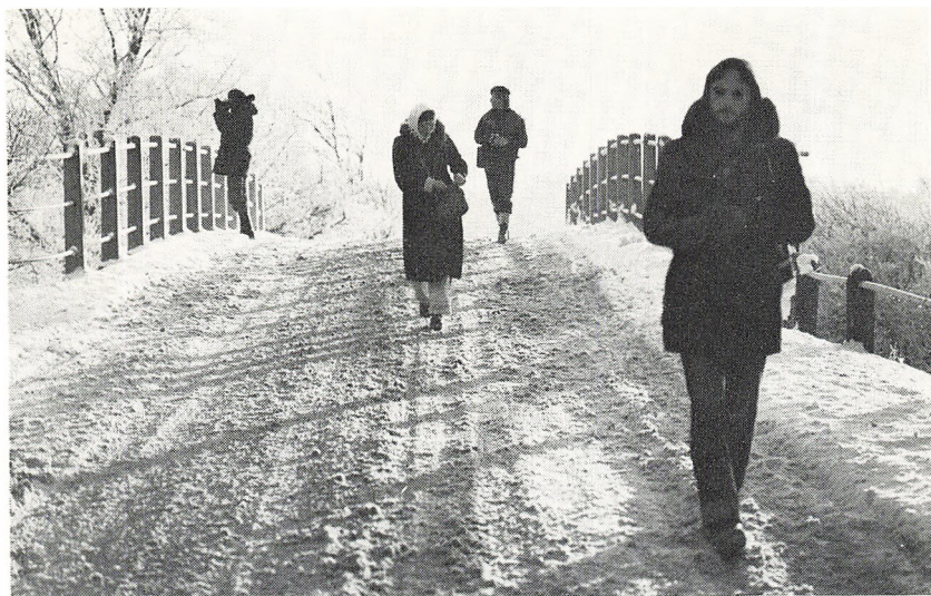
Ad Estrupvejen i november.