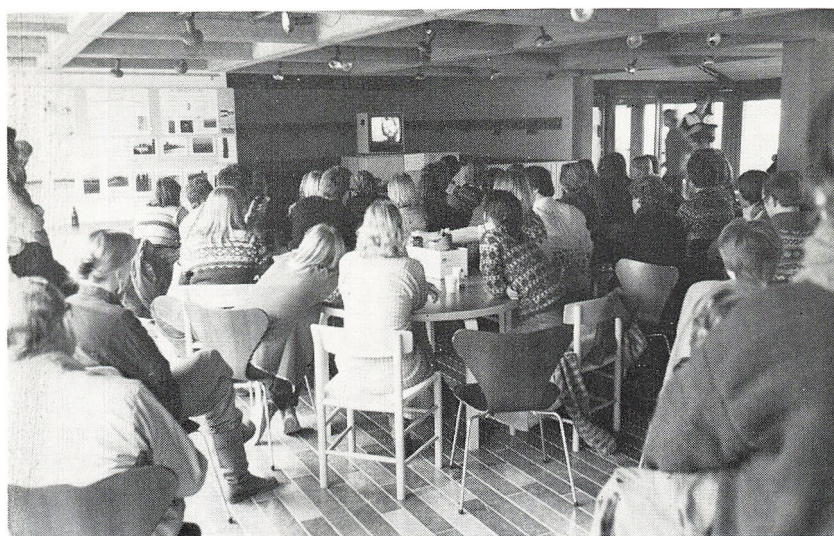
Intern video i Gule Hus under temaugen.