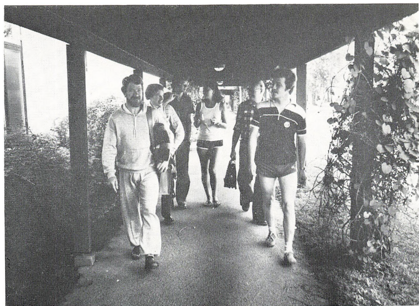
På vej til time.