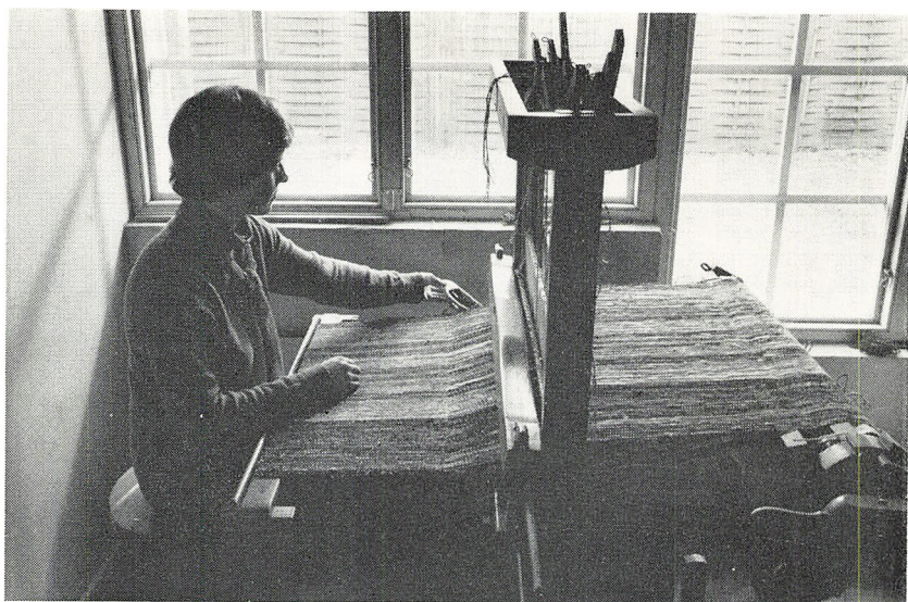
Fra Spindegårdens vævestue.