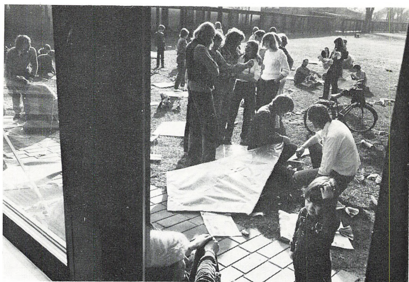
Temadag med dragebygning.