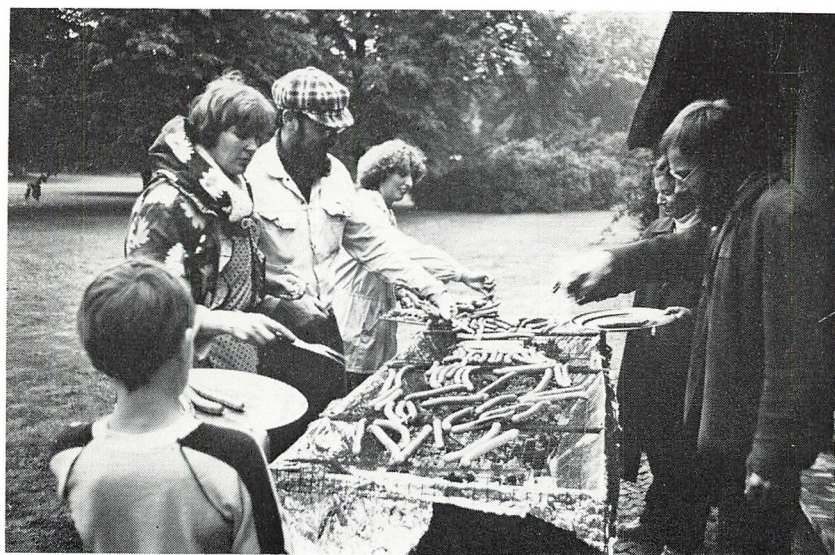
Lærerne griller pølser ved Sct. Hansfesten.