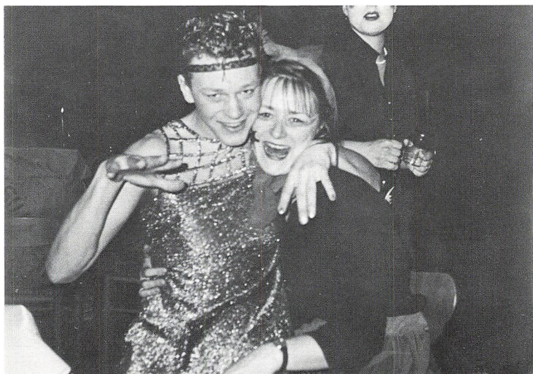
Karneval, vinteren 1987.