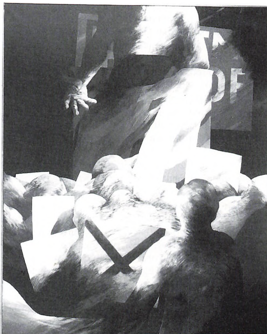
Poul Janus Ipsen: Folketaleren (1972). Esbjerg Kunstpavillon.

Kunstneren kan så vælge at male med kraftige pastose strøg eller udføre hårfine billedkalkuler med fine fordrevne strøg og så er der alle de talrige muligheder, der ligger mellem de to yderpoler.