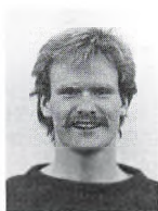
Ulf Bromose Klostertorvet 10 8000 Århus C.