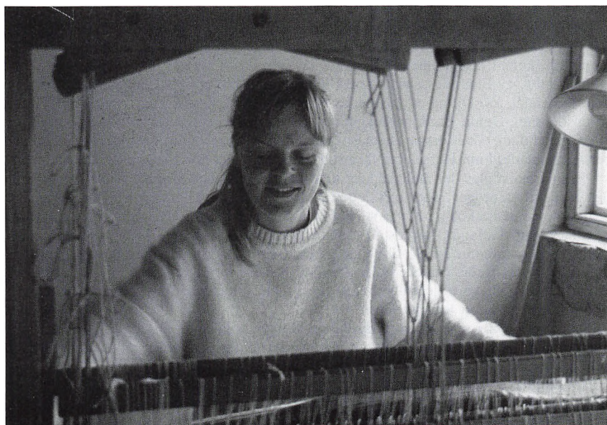
Forfatteren på yndlingspladsen, bag væven i Spindegården

Tak til alle, der var med til at få sommerskolen til at blive, hvad den blev - et livsberkæftende åndehul!