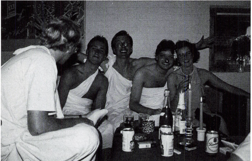
Æblegården før togaparty i Askovhus