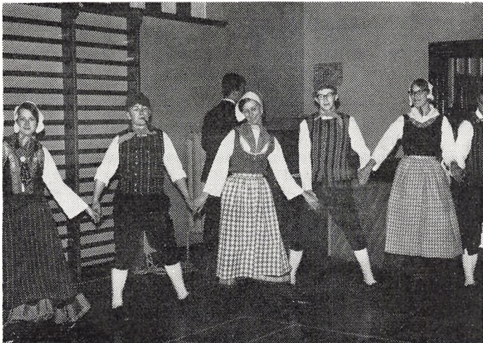
Fra opvisningen i folkedans

Guld med emalje 6, sølv med emalje 8, guld 13, sølv 4, bronze 5. Livredderprøven 13, frisvømmerprøven 14, svømmeprøven 5.