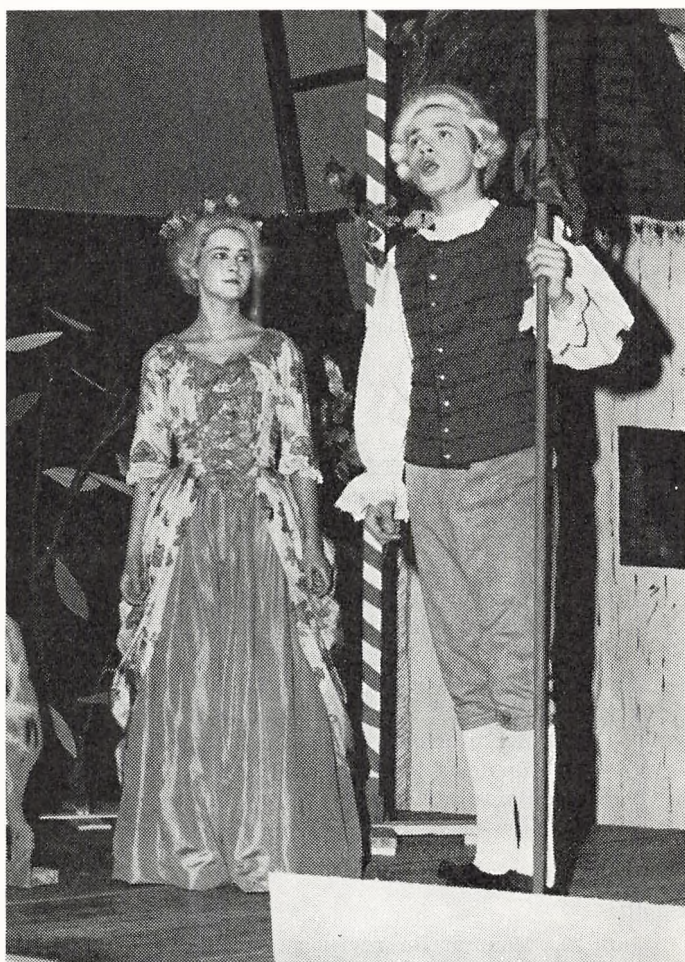
Fra opførelsen af »Majdronningen« (jfr. dagbogen under 17. marts)