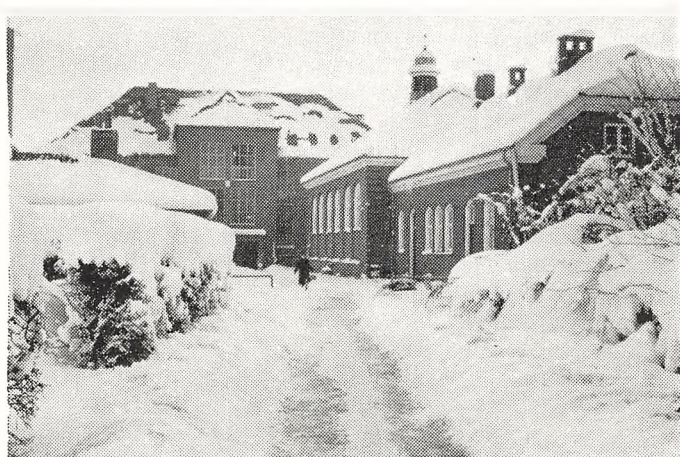
15. november 1965! Eller 15. april 1966?