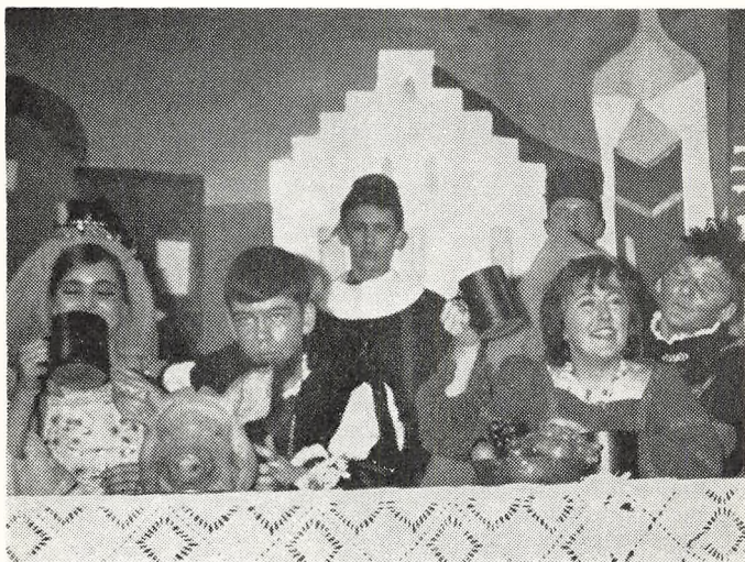
Det gamle spil om Enhver.