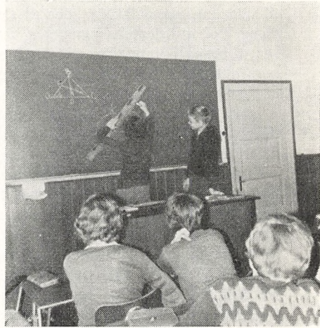
Det ser noget trekantet ud.