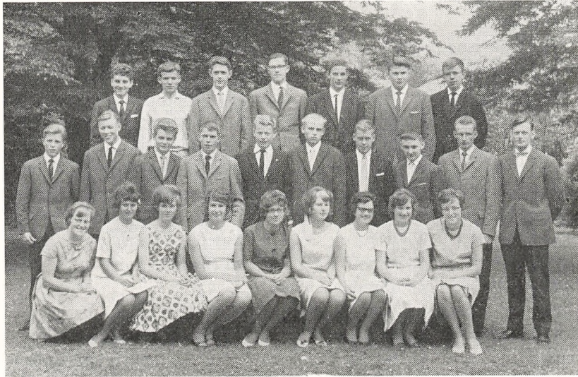
Real b 1962.