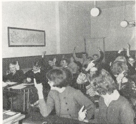
Det ved vi da godt.