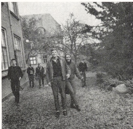
— det gør vi osse.