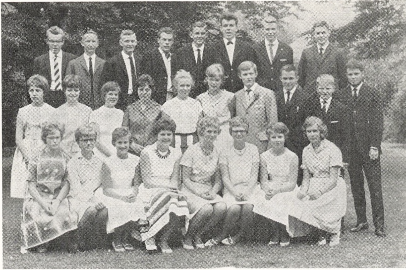
Real a 1962.