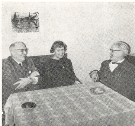
De tre nye lærere.