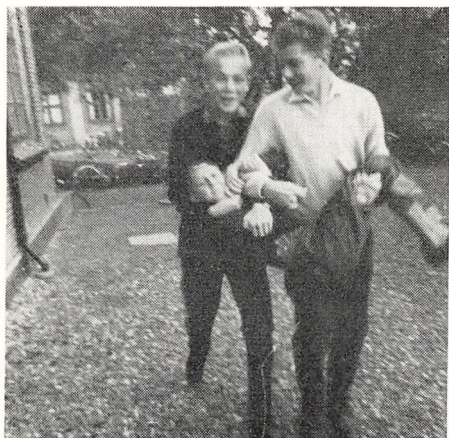
Fri hane — så går vi ind.