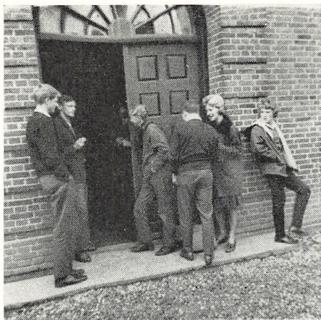
Dørvogteren er hårdt trængt