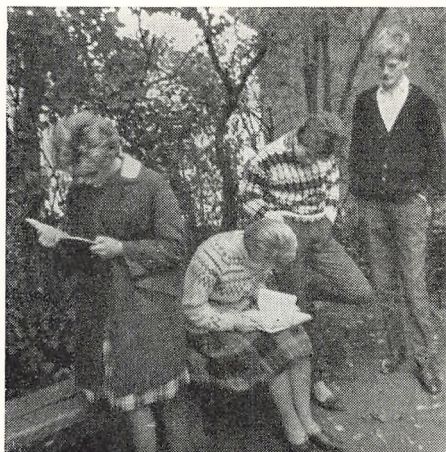
Hvad er forskellen på en to-og en firetakts motor?

Skolen havde i det forløbne år syv klasser med ialt ca. 145 elever. I skoleåret 1962—63 er elevtallet formindsket til ca. 125 elever, således som det var forudsagt i den i fjor opstillede beregning over elevtallet. I år er der derfor kun seks klasser, nemlig parallelklasser hele vejen igennem.