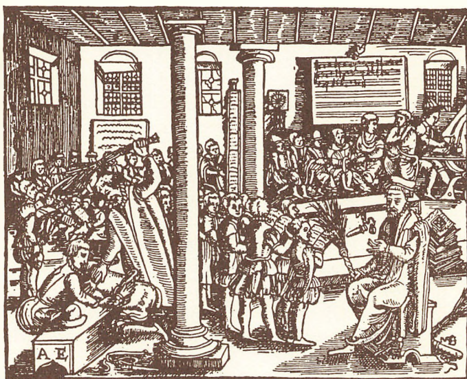
Skoleliv henimod 1600. Efter Rosnow: Kulturbilder.

c. udeboende på 22 år og derover: 20.400 kr.