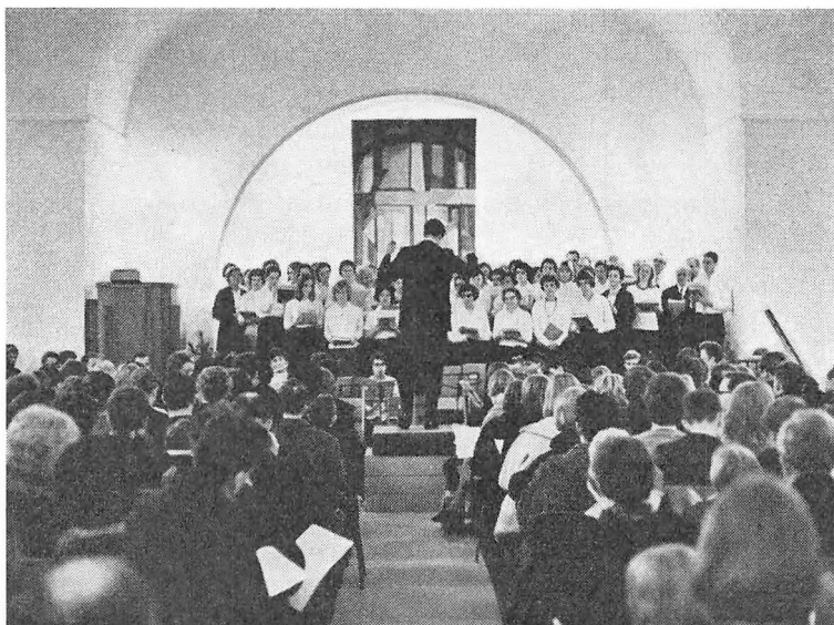
Første koncert med forældrekoeret i Virum Kirke

året 1964 endnu et betydningsfuldt træk til skolens musikliv: forældrekoeret. Den første prøve afholdtes onsdag den 28. oktober 1964, og onsdag har været fast sangaften siden. Koeret trives helt på frivillig basis og ledes af skolens musiklærere. Alle forældre til nuværende og tidligere elever på skolen har adgang. Korsæsonen varer fra den første onsdag i september til den sidste onsdag i april.