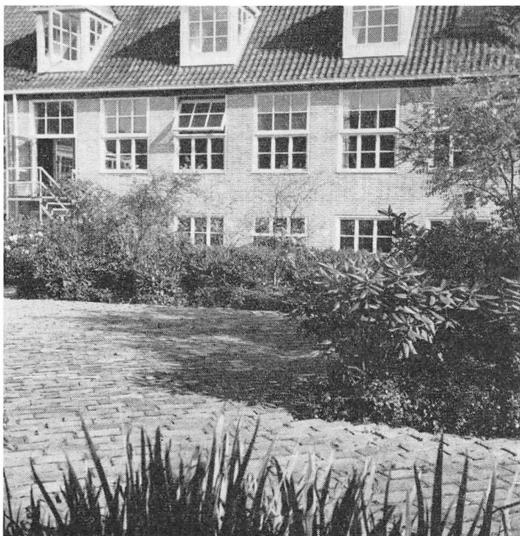
Virum Statsskoles indre gård