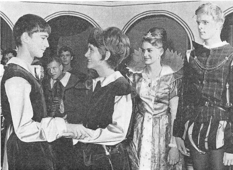
En scene fra årets skolekomedie

Af overskuddet ved de årlige skolekomedier overføres \frac{1}{3} , dog højst 500 kr., til en teaterkasse. Dette beløb henstår som garantikum for den følgende skolekomedie, og af de i denne teaterkasse opsparede midler afholdes udgifterne til udbygning og forbedring af skolens scene. Denne sidste bestemmelse har