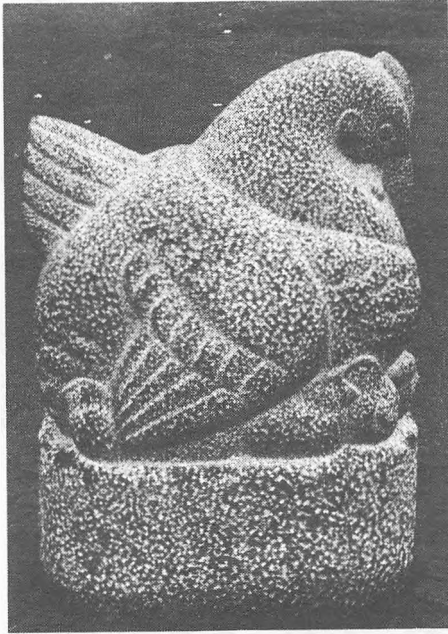
Skulpturen afsløret: Høne med kyllinger.