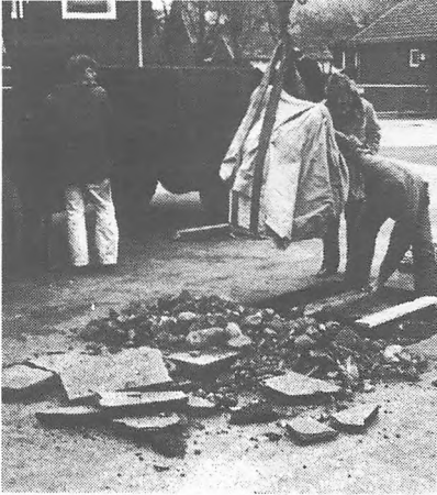
Skulpturen bringes på plads