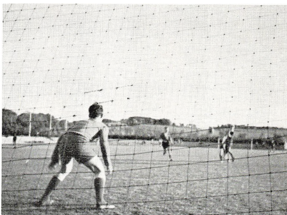
... når nettets masker er bag ved Mogens, er de beskyttet så godt som nogens.

Fodbold: Ved samme stævne spillede mellemsk.'s fodboldhold finale i skoleturneringen mod Rosenvangskolen. De to hold, der begge var gået ubesejrede gennem de indledende kampe, gav hinanden en meget jævnbyrdig og spændende kamp. Resultatet blev en kneben sejr på 1—0 til Vestergårdsskolen, hvorved vore drenge vandt den udsatte faneplade.