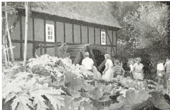
... får sig et nyttigt indblik i udnyttelsen af energi.