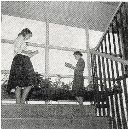
... i tegning man stedse med større iver finder sig skønne perspek- og motiver.

I 1958/59 er der vist 88 film. Der har i alt været 242 forevisninger, d. v. s. at hver elev gennemsnitlig har overværet ca. 7 undervisningsfilm i løbet af skoleåret.