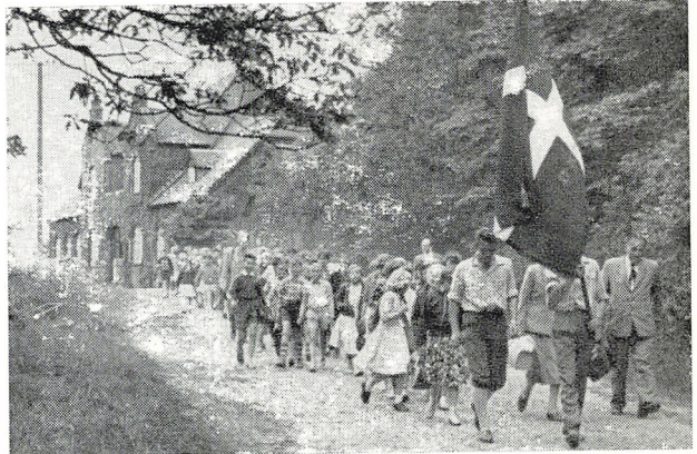
... 1200 ben vandrer to og to mod Dollerup, Hald og Niels Bugges kro.