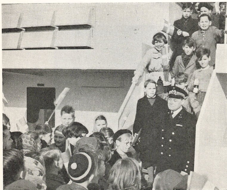
Ombord på »Jens Bang«.

30. marts modtog eleverne fra 5. og 4. klasserne »Jens Bang« med »Jylland mellem tvende have« og inviteredes derefter på en forfriskning ombord.