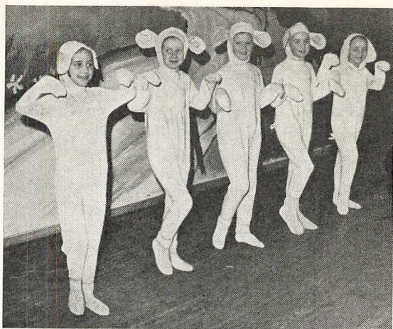
De 5 små grise.

13. september var overskolens og 5. klasses elever til færdselspropagandafilm i Paladsteatret.