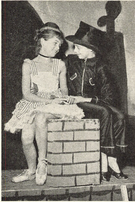
Hyrdinden og skorstensfejeren. Fra skolefesten.

skolens elever om færdselsproblemer og foreviste politiets færdselsfilm.