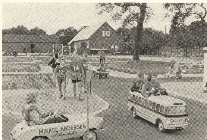
5. b på Færdselsskolen

Bestyreren takkede for velkomsten og udtalte håbet om godt samarbejde med skolens lærerstab og elever og bød de tre nye lærerkræfter velkommen.