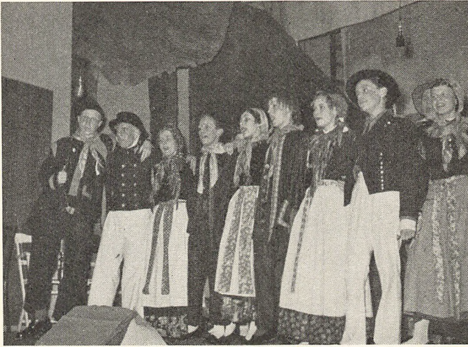
»En søndag på Amager«