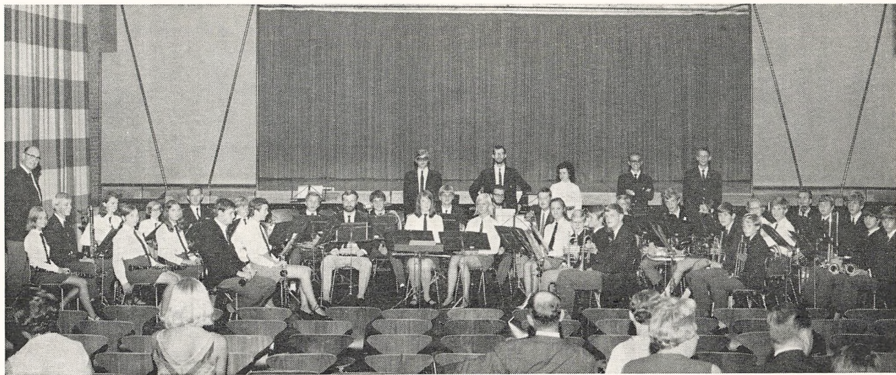
Nordjysk Ungdomsorkester, august 1968