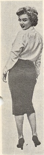
Marilyn Monroe, — hvem kunne ikke tænke sig hende som partnerske?