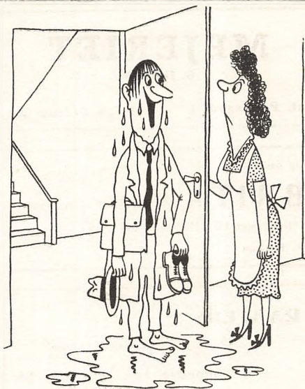
Knippelsbro var oppe!