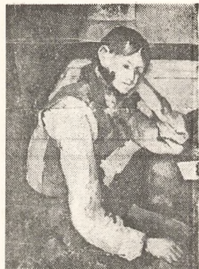
Cezanne: Drengen med den røde vest