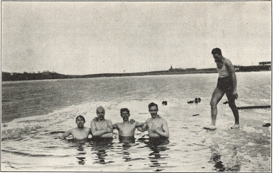
Roskilde Højskoles Vikinger 1931—32.