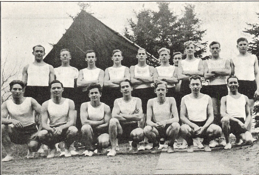
Roskilde Højskoles Gymnastikhold 1931—32.