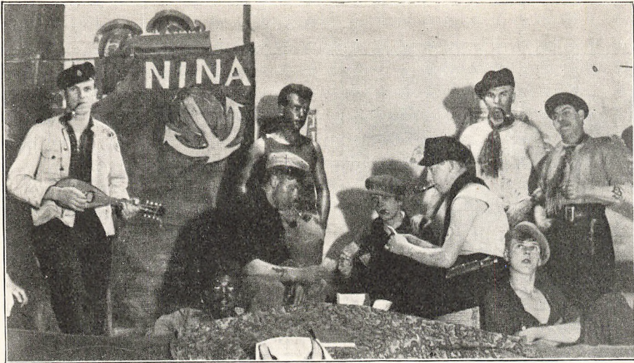
Det engelske Sangkor synger Sømandsviser.