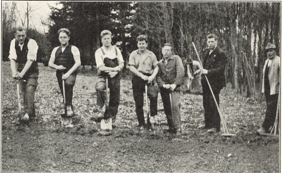
Roskilde-Elever paa Foraarsarbejde i Haven.