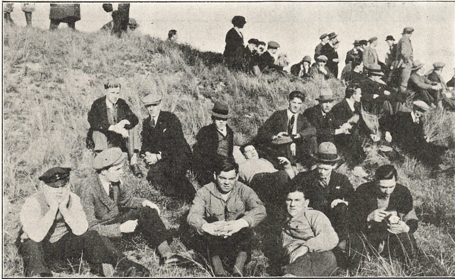
Hvil i Klitterne paa Fanø.