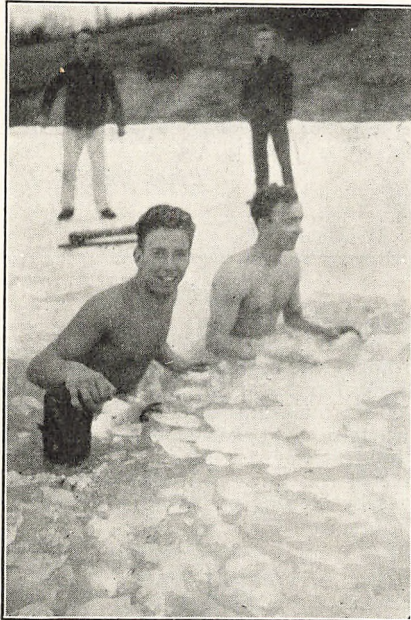
En kold Dukkert.

H. C. Hansens Oversættelse »Grubearbejdernes Sang« i sidste Nr. kan man sammen med mange andre gode Vers finde i H. C.s Debutbog, Digtsamlingen »Tro og Trods«, der imidlertid er udkommet paa Forlaget »Fremad«. Sukces'en kan allerede fastslaaes.