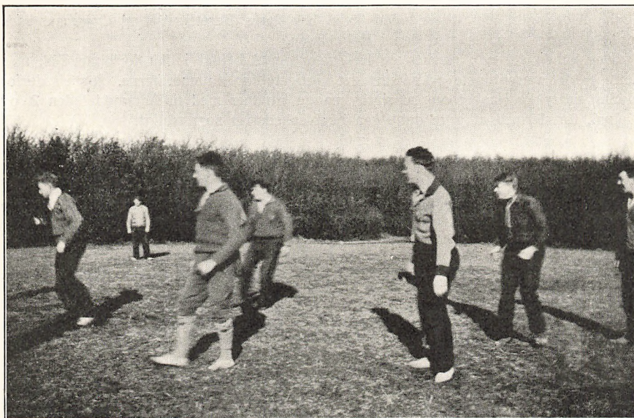
Haandbold paa den store Plæne.