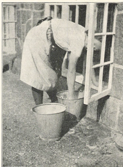
Hovedrengøring paa Esbjerg Arbejderhøjskole