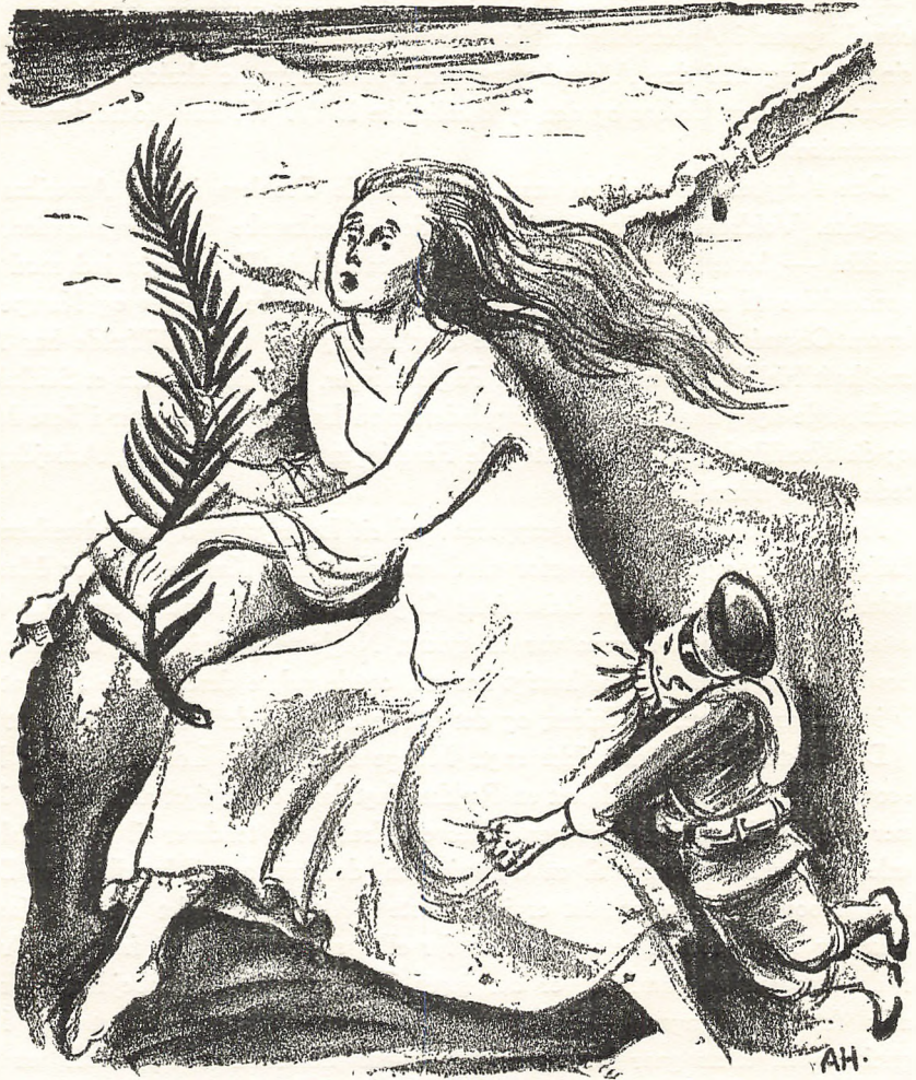
Tegning af Anton Hansen